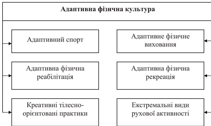
Рис. 1 Основні компоненти адаптивної фізичної культури

ди розвитку адаптивного спорту в Україні» Зведеного плану науково-дослідної роботи в сфері фізичної культури і спорту на 2011–2015 р. Міністерства України у справах сім'ї, молоді та спорту (номер державної реєстрації 0113U004011)