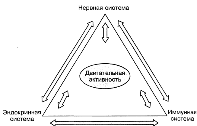
Рисунок 1 — Двигательная активность и взаимодействие нервной, эндокринной и иммунной систем [1]

Существует мнение, что при напряженных кратковременных физических нагрузках