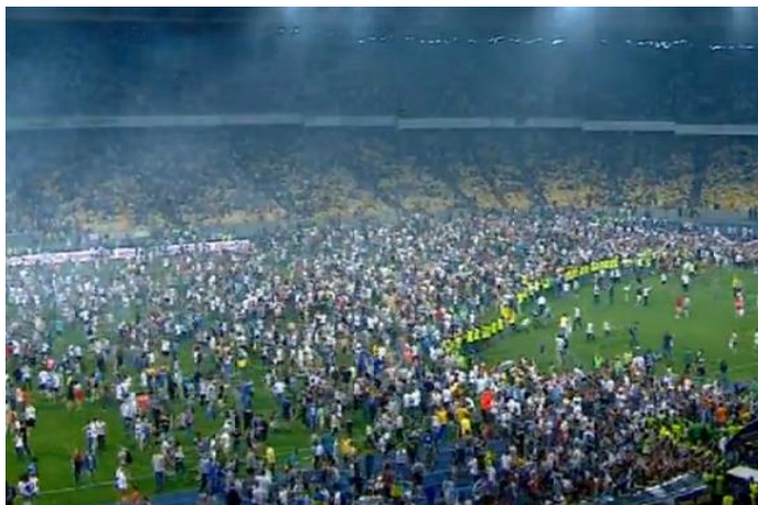
Рис. 3. Безлад після закінчення матчу за Кубок України між футбольними клубами “Динамо” (Київ) і “Шахтар” (Донецьк) на НСК “Олімпійський” в Києві.

на останніх хвилинах матчу. Відмічається, що дії поліції в цій ситуації були непрофесійними. В результаті загинуло 328 і постраждало близько 4000 осіб [24].