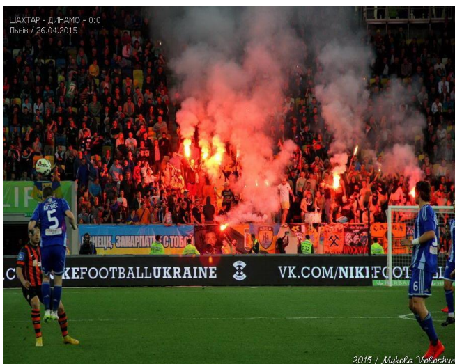
Рис. 2. Протиправні дії фанатів на матчі Шахтар –Динамо у Львові 26.04.2015.

Масовий безлад на стадіонах найчастіше відбувається під час футбольних матчів.