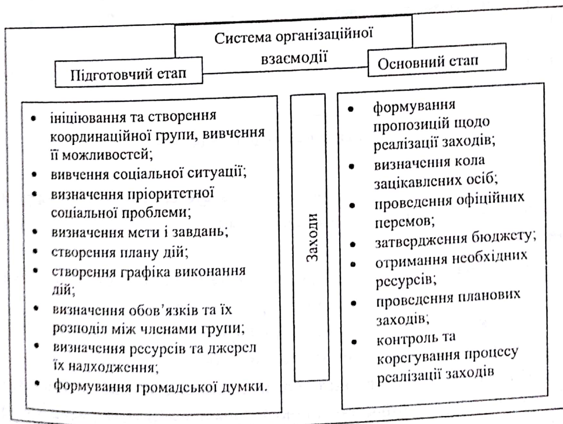
Рис. 2. Перелік заходів щодо налагодження організаційної взаємодії в системі спорту для всіх на муніципальному рівні [4]

1. Здійснити аналіз факторів, що впливають на процес залучення населення до спорту для всіх на місцевому рівні.