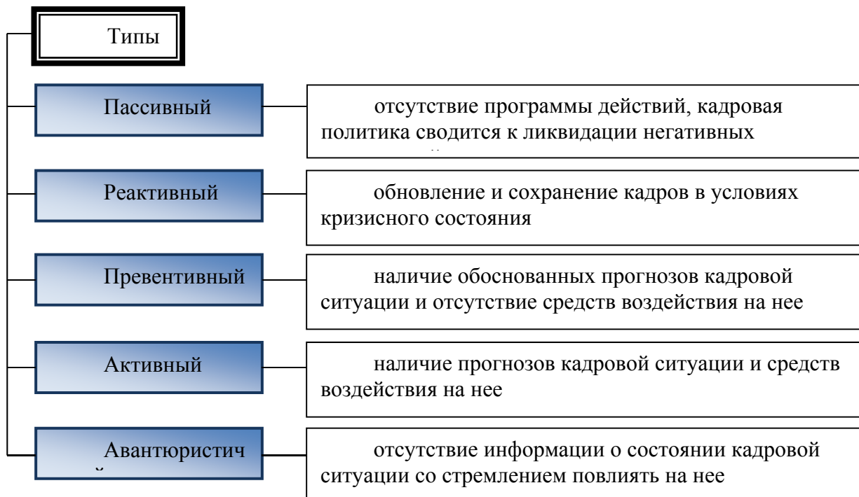
Рис. 2. Типы кадровой политики

Таким образом, кадровая политика в адаптивном спорте – это система правил и норм по которым готовятся специалисты для спортивной работы с лицами с инвалидностью. Главной целью стратегии развития кадровой политики в адаптивном спорте должно быть достижение оптимального уровня формирования и использования трудовых ресурсов для обеспечения потребностей в сфере предоставления физкультурно-оздоровительных и спортивных услуг для лиц с инвалидностью, в том числе участникам военных действий в зоне АТО с обеспечением реализации конституционных прав граждан на труд, отдых, социальную защиту и т.п.