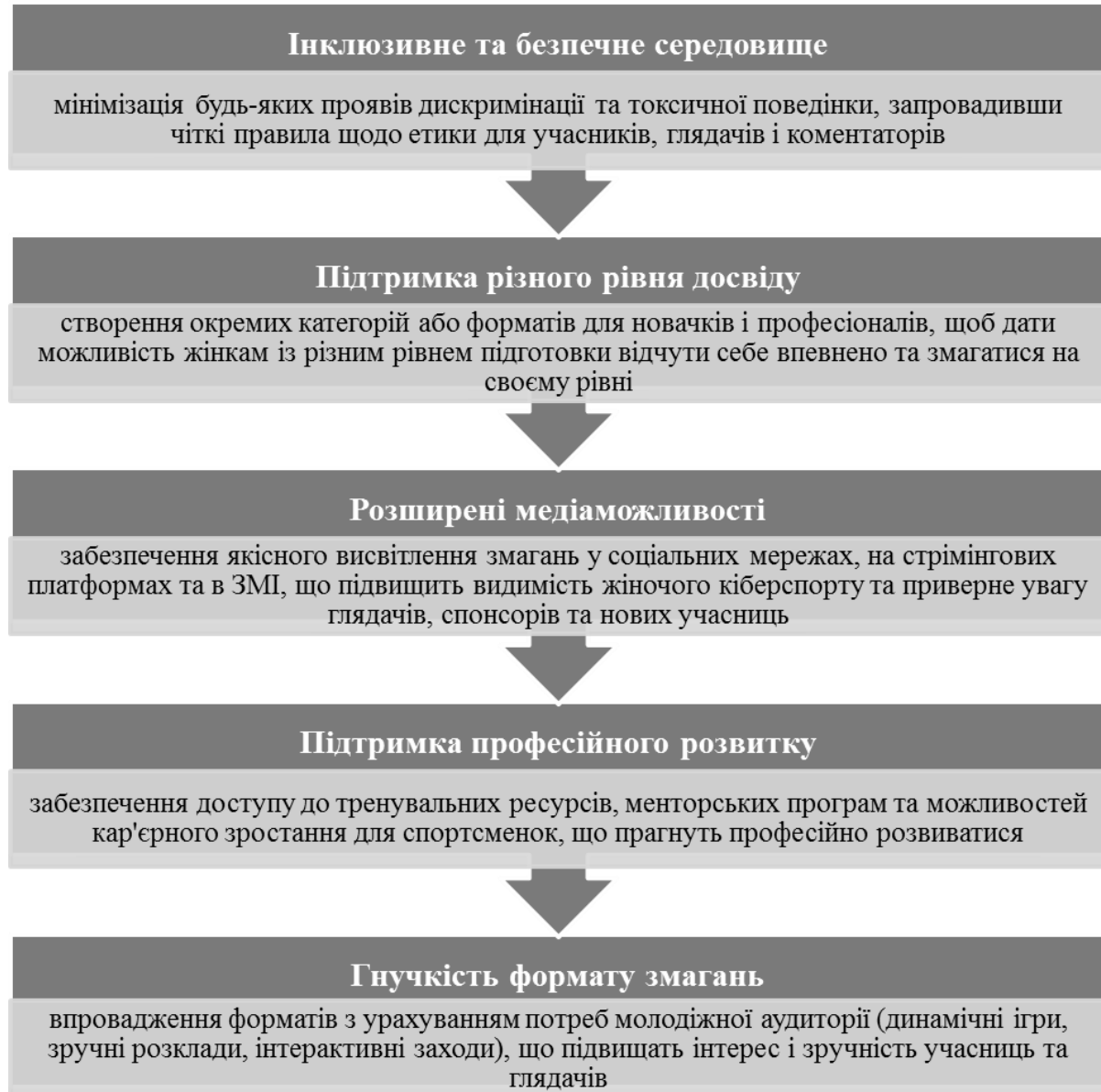
Рис. 3.3. Підхід до організації жіночих турнірів в кіберспорті

Враховання зазначених факторів дозволяє організаторам створити інклюзивне середовище, сприяти залученню нових талантів, зменшити психологічні бар'єри та популяризувати жіночі змагання у кіберспорті. На основі проведеного аналізу запропоновано організаційний підхід до проведення жіночих турнірів (рис. 3), що включає кілька етапів, кожен із яких спрямований на подолання основних перешкод та сприяння сталому розвитку цієї сфери.