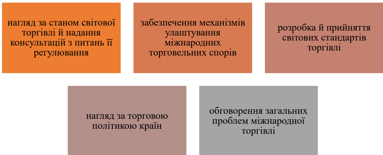
Рисунок 1 – Характеристика функцій Світової організації торгівлі

Розглянемо функції, які виконує Світова Організація Торгівлі на рисунку 1 [2, с. 134].