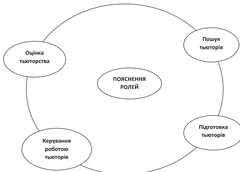
Рис. 1. Коло якості тьюторства

Якість тьюторства в опануванні германськими мовами залежить від успіху різних робочих процесів, які можна відобразити у кругообігу підвищення якості роботи тьюторів (рис. 1).