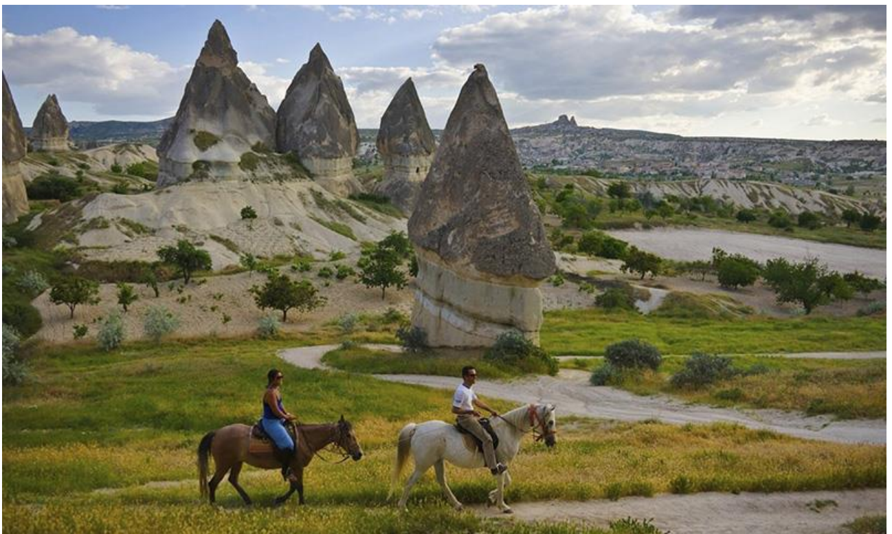
Рис. 1.3. Каппадокія – маршрути прогулянок на конях

Кінна Поїздка на Заході Сонця в Каппадокії. Під час перебування в Каппадокії можна отримати незабутні враження, вирушивши на фантастичний тур верхом на коні по мальовничих долинах регіону.