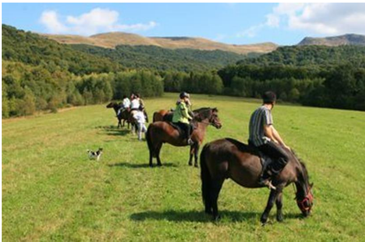
Рис. 1.4. - Кінні прогулянки у Польщі - Бескидські гірські дороги.