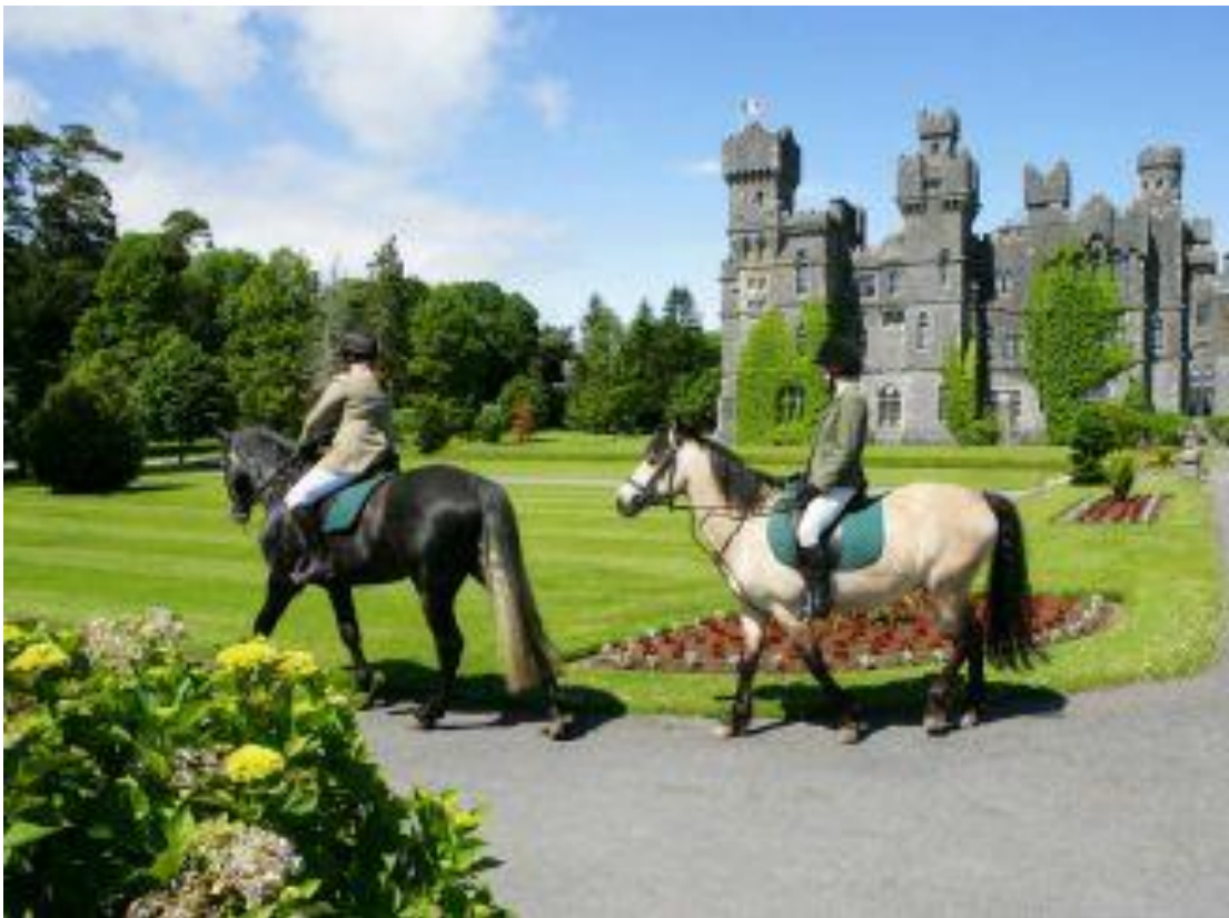
Рис. 1.2. Ірландія – кінний туризм

Ірландія - рай для любителів кінного туризму.