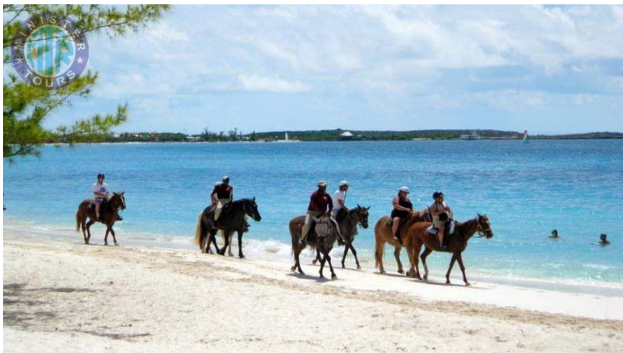
Рис. 1.3. Анталія – кінні прогулянки

Досвідчений інструктор українською мовою на початку туру детально пояснює гостям основні правила верхової їзди та навчає, як правильно сідати в сідло та тримати поставу під час поїздки. Ці навички будуть корисні не лише під час відпочинку, а й у майбутньому. Абсолютна безпека під час туру гарантується, оскільки коні спеціально навчені співпрацювати з початківцями у верховій їзді, а кожен гість має особисте страхування від німецької страхової компанії.