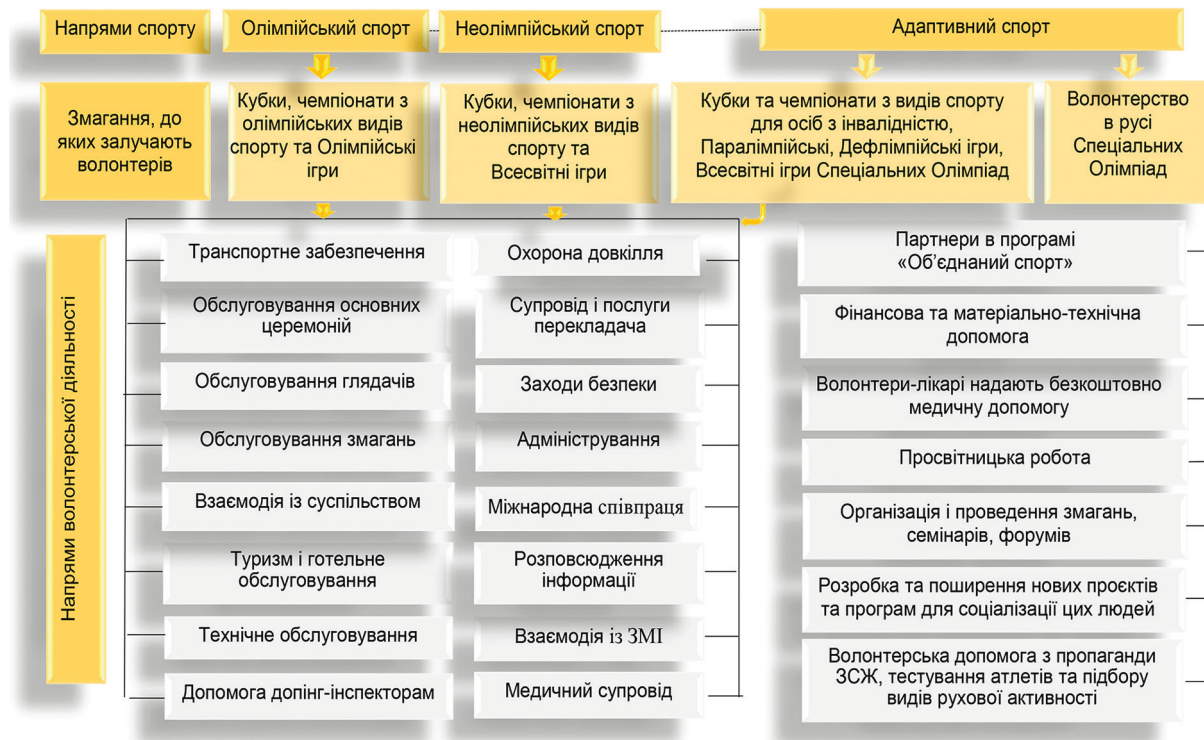
Рисунок 4 – Діяльність спортивних волонтерів в різних напрямках спорту

кий спектр можливих напрямів роботи (рис. 4). Волонтерство у русі Спеціальних Олімпіад реалізується на змагальному та тренувальному етапах, що й обумовлює існування різноманітних волонтерських програм.