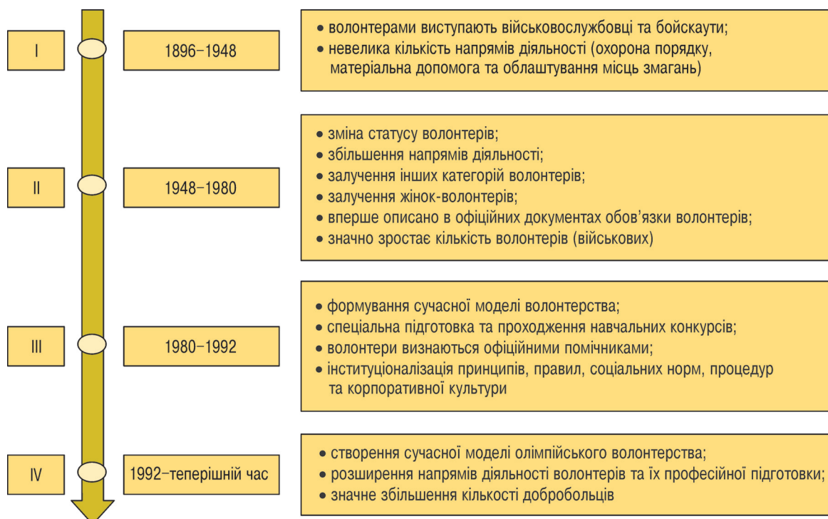
Рисунок 1 – Характеристика розвитку олімпійського волонтерського руху