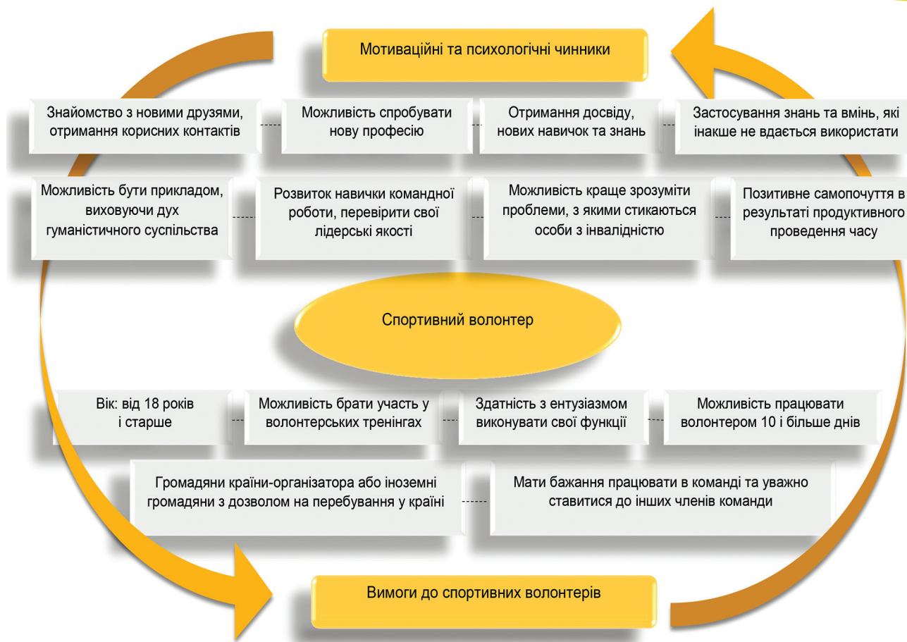
Рисунок 3 – Вимоги до спортивних волонтерів та чинники, які спонукають до занять волонтерством

Виходячи із викладеного, варто відмітити тенденцію до збільшення кількості залучених волонтерів до організації та проведення Ігор протягом останніх чотирьохрічних періодів. Аналізуючи представлену інформацію, ми визначили, що найбільшу кількість волонтерів було задіяно під час Олімпійських ігор 2008 р. у Пекіні, це можна пояснити значними ресурсними можливостями держави та високою кількістю населення.