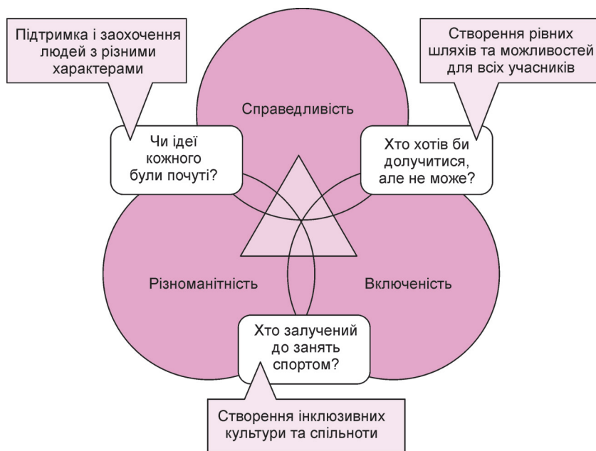
Рисунок 2 – Характеристика ключових індикаторів побудови інклюзивної спортивної культури

ся без обмежень. Прийняття окремих провідних спортсменів з маргінальними характеристиками не є показником рівних можливостей для всіх у спорті. Кожна спортивна організація має прагнути бути інклюзивною та відкритою для всіх членів громади. Індикатор різноманітності – це поєднання різних атрибутів і походження людей (тобто раси, етнічного походження, статі, віку, інвалідності, сексуальної орієнтації, релігії). У сучасній науковій літературі спектр категорій маргіналізованих осіб у спорті не є вузьким та не обмежується лише особами з фізичними, розумовими або сенсорними вадами. Дане твердження співвідноситься з широким розумінням терміна «особливі освітні потреби», який, відповідно до Саламанської декларації [116], охоплює всі форми різноманітності. Численні дослідження підкреслюють, що такі індивідуальні характеристики як стать [26, 43, 69, 75, 110], сексуальна орієнтація та гендерна ідентичність [16, 21, 30, 50, 108], раса та етнічна приналежність [46, 56, 88, 105, 118], корінне [9, 40, 82, 107, 109, 111] та міграційне походження [65, 71, 97, 104, 105], мова, культура та релігія [17, 37, 87, 95, 118], вік [2, 7, 10, 31, 103] та інвалідність [57, 63, 83, 92, 93] відіграють значну роль в обмеженні можливостей для участі у спор-