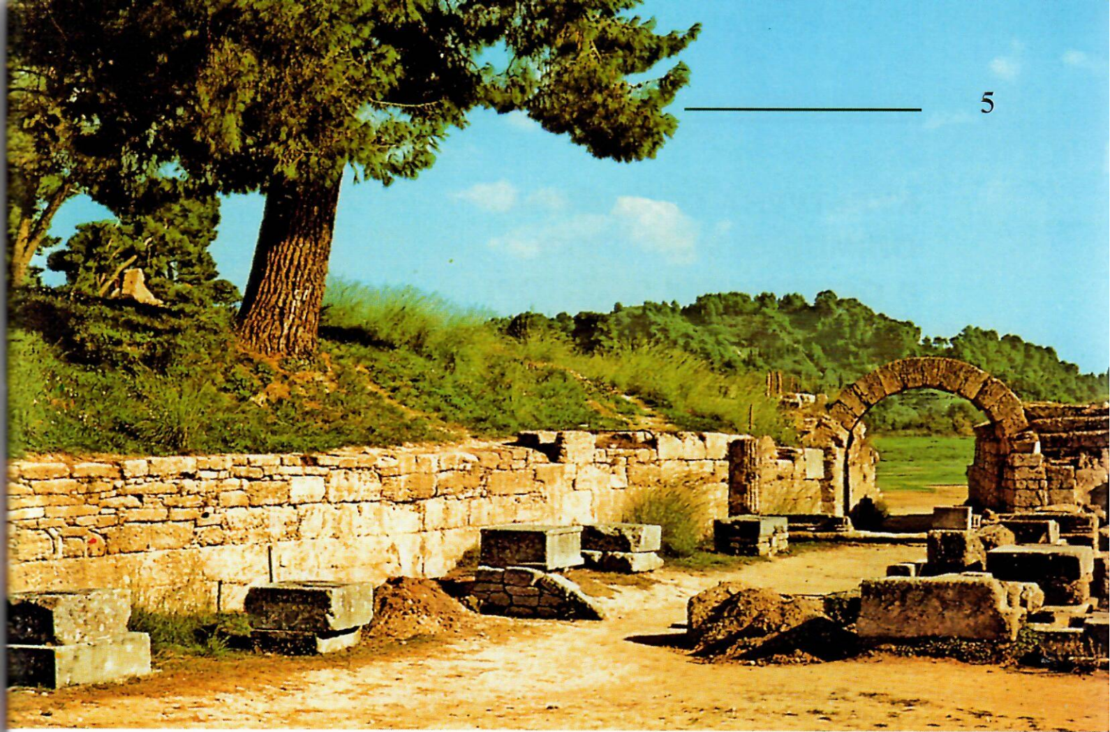
Сучасний вигляд входу на стадіон в Олімпії

Під час вивчення теми «Дослідження Геродота» стануть у пригоді ілюстрації артефактів, які свідчать про зародження олімпійської ідеї на території Північного Причорномор'я, Ольвії та Херсонесу.