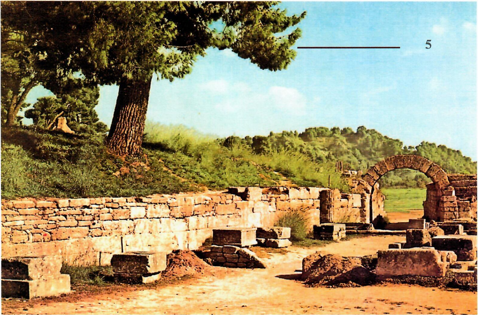
Сучасний вигляд входу на стадіон в Олімпії