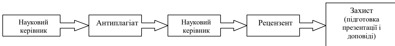
Рис. 1.Схема підготовки роботи на етапі підготовки до захисту

Схема підготовки роботи, визначення її оригінальності і проходження через рецензування представлена на рис. 1.