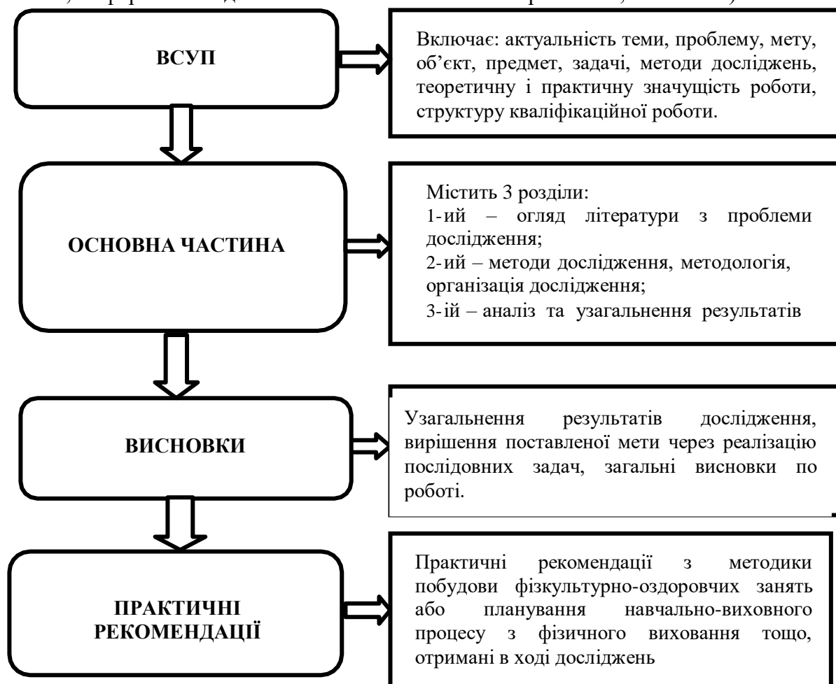
Рис. 1. Структура і зміст кваліфікаційної роботи

Частина цих компонентів (титульний лист, зміст, вступ, висновок і список використаних джерел літератури) можна віднести до нормативних – їх зміст регламентується нормативними документами, а оформлення здійснюється за обов'язковими правилами, шаблоном).