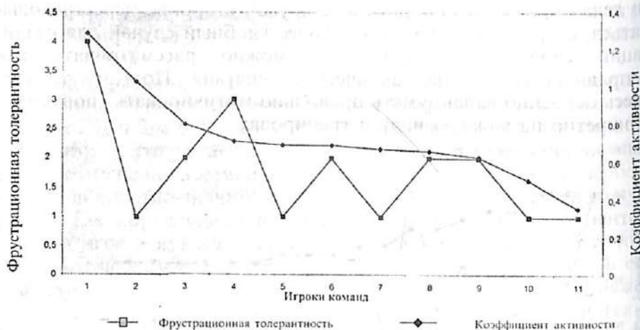
Рис. 2. Взаимосвязь фрустрационной толерантности и коэффициента активности игровых действий

не принося, таким образом, полезных действий команде — работоспособность при этом будет снижаться.