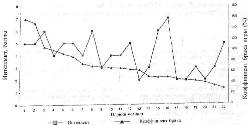
Рис. 3. Взаимосвязь показателя интеллекта и коэффициента брака игры

ные зависимости показателей "жесткости—чувствительности", "доверчивости—подозрительности" и количества времени участия в игре (при r=-0,55 ; -0,56 ), "практичности—развитого воображения" и коэффициентов эффективности (при r=-0,71 ) и брака игры (при r=0,66 ), говорит о том, что для футболистов, проводящих активную и эффективную игровую деятельность, свойственны такие качества личности как мужественность, самоуверенность, практичность, терпимость, уживчивость в команде, легкость во взаимоотношениях, практичность, добросовестность и т.д. Показатель взаимосвязи "жесткости—чувствительности" с коэффициентом активности игры (при r=0,54 ), также подчеркивает значимость проявления в игре традиционных для игроков качеств, таких как устойчивость, понимание и зависимость от партнеров по команде.