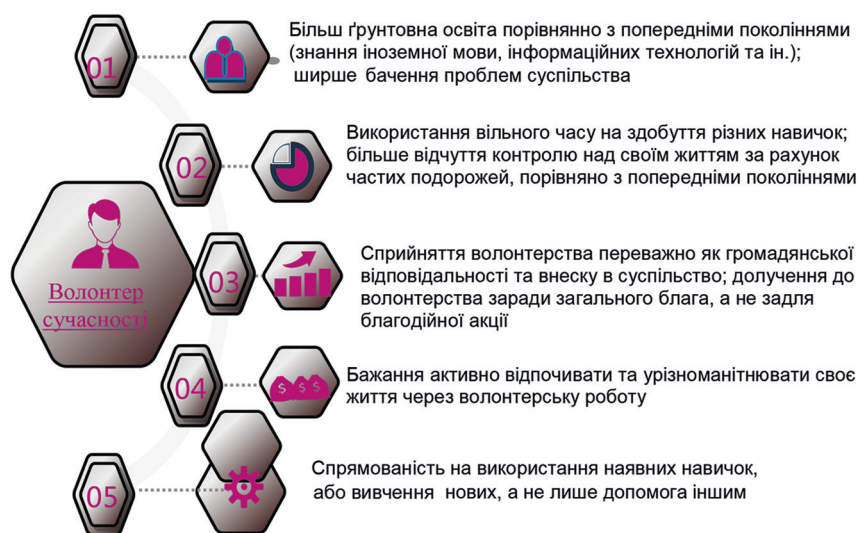
Рисунок 1 – Новітні характеристики та переваги сучасних волонтерів

нії (DEN), Литовський спортивний університет (LTU), Європейський волонтерський центр CEV (BEL), Університет прикладних наук Хаага-Гелія (FIN) та Клуб Тартуський марафон (EST). Отже, враховуючи все сказане, можна стверджувати, що реалізація подібних проєктів сприяє інтернаціоналізації волонтерства, міжнародному співробітництву та глобалізації спортивного волонтерського руху [14].