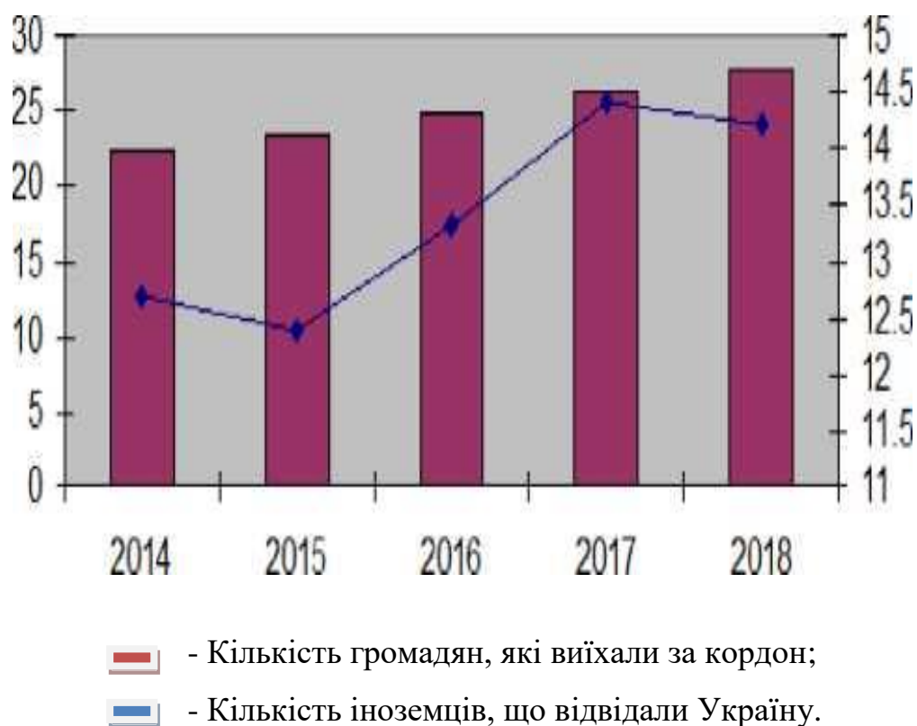
Рисунок 2.1 – Туристичні потоки в Україні за 2014-2018 роки (Джерело: Державна служба статистики України, 2019)

Статистика по кількості іноземних громадян, які приїхали в Україну, показує, що після 2014 року спостерігається різке зниження відвідувань через політичну нестабільність, військовий конфлікт і несприятливу криміногенну обстановку в країні. Максимальна кількість громадян, що в'їхали в Україну, було зафіксовано в 2018 році – 14,2 млн. осіб, найменше – у 2015 році – 12,4 млн. осіб. На відміну від стрімкого зниження числа громадян, які приїхали в Україну в 2015 році, кількість українських громадян, які виїхали за кордон, зростала. З об'єктивних причин кількість громадян, які виїжджають з метою туристичної поїздки, скоротилася, а кількість громадян, що прямують на трудову міграцію в період соціально-економічної нестабільності в країні, збільшилася з 26,4 млн. осіб у 2017 році до 27,8 млн. осіб в 2018 році, збільшившись на 5,3%. Хоча традиційно прикордонні райони є лідерами за