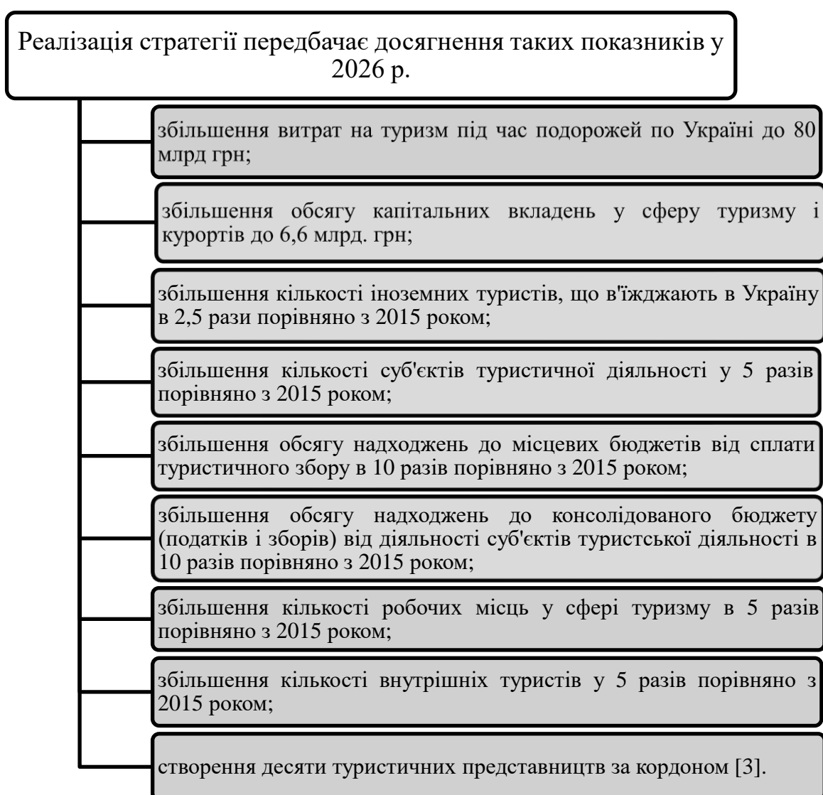
Рисунок 3.2 Передбачення досягнення показників у 2026 році від реалізації Стратегії.

Фінансове забезпечення реалізації стратегії здійснюється за рахунок державних коштів і місцевих бюджетів, туристичних фірм та агенцій, кошти міжнародної технічної допомоги, інші міжнародні донори, фінансові організації (установи), коштів інвесторів та інші джерела, які не заборонено законом.