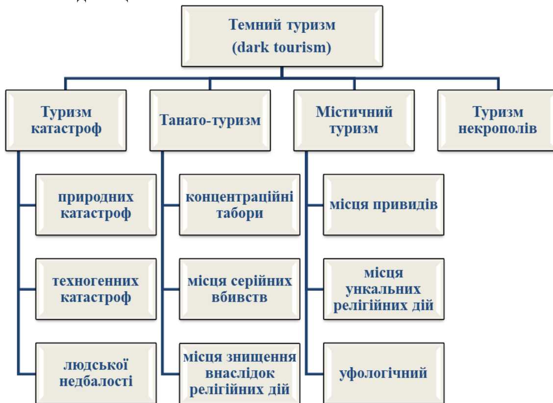
Рис.1. Різновиди «темного» туризму

Туризм катастроф орієнтується на людей, які цікавляться подорожами до місць стихійних лих та місць, що доведені людством до надзвичайних станів. Користуються відомістю регіони світу, які постраждали від природних катастроф, ураганів, вивержень вулканів. Як об’єкти темного туризму використовують місця катастроф космічних тіл. На території України розташовано Іллінецький метеоритний кратер (40 км від м.Вінниця) та Бовтиський метеоритний кратер у м. Олександрія (Кіровоградська область) [10,155].