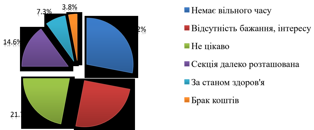
Рис. 3.2 Мотиви відсутності бажання відвідувати уроки фізичної культури (на думку школярок, n=27)

Зауважимо, що більше третини, а саме 58,9%, дівчат не відвідувати б урок фізичної культури якщо це було б не обов'язково – це більша кількість, аніж тим, кому урок з різних причин не подобається. Міркуємо, що позитивне сприймання фізичної культури буде залежати від обізнаності, вихованих звичок, зокрема відвідування секцій. Тому ми також і спробували дізнатися чи відвідують дівчата секції з видів спорту. Нами з'ясувалося, що більше половини, а саме 65,2% дівчат не відвідують секції з різних рухової активності, вказуючи різні причини (рисунок ).