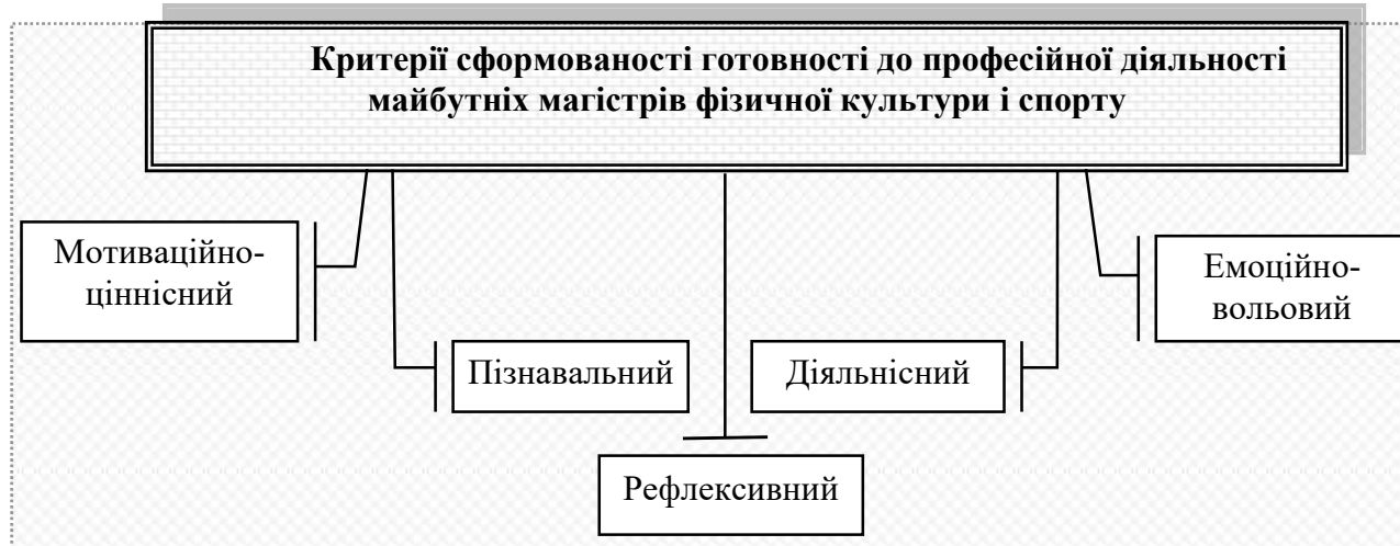
Рис. 1. Критерії сформованості готовності до професійної діяльності майбутніх магістрів фізичної культури і спорту

Нами виокремлено критерії (мотиваційно-ціннісний, пізнавальний, діяльнісний, емоційно-вольовий, рефлексивний), визначено відповідні показники та охарактеризовано рівні сформованості зазначеної готовності (рис. 1).