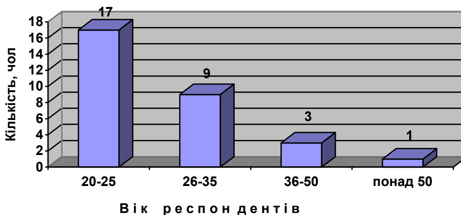
Рис. 2.1. Розподіл респондентів за віком

Водночас недостатній досвід роботи з волонтерами об'єктивно свідчить про те, що волонтерський рух в Україні набуває свого відновлення після тривалої перерви і може вважатися молодим, принаймні у спорті. Таким чином, можна відзначити як позитивні, так і можливі негативні наслідки впливу ринку на розвиток сфери фізичної культури і спорту в Україні.