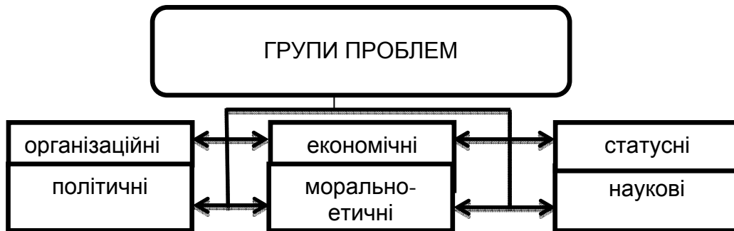
Рис. 2. Основні групи проблем в неолімпійському спорті.

Разом із активним поширенням неолімпійських видів спорту у світі існує низка об'єктивних та природних проблем, що характерні цьому явищу, їх систематизація та умовна класифікація дозволить більш ефективно вникнути у їх сутність та сприятиме пошуку та розробці адекватних методів та засобів їх вирішення (рис. 2).