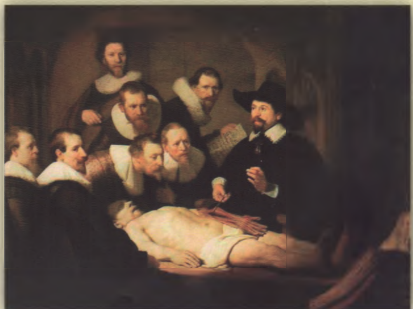
Урок анатомії доктора Ніколаса Тулпа. Рембрандт ван Рейн. 1632 р.

Проте анатомія означала не лише проникнення та деконструкцію. Вона також передбачала публічний показ. Розтини в анатомічному театрі були справжнім видовищем — театром у буквальному розумінні; а їм відповідали інші види тілесного показу, особливо пишномовна демонстрація жіночої краси у традиції, за якою поет ранжував частини своєї пані як трофеї для еротичного замилювання. З подвійним сенсом королева Єлизавета примудрилася використати цю традицію для власних цілей, прославляючи себе й перетворюючи власне тіло, з крихтою поетичної вільності, на