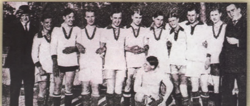
Одна з перших футбольних команд

Усе тодішнє офіційне футбольне життя Харкова об'єднувала "Футбольна ліга", що відала організацією змагань і керувала спортивними колективами. Харківські футбольні команди проводили матчі на першість міста, а також міжміські ігри. Зустрічалися з київськими командами (серед яких виділялася чеська команда), з Юзівкою, Краматорівкою — в її команді грали здебільшого французи; з Одесою, де тоді