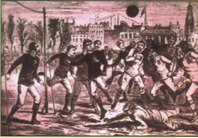
Міжнародний матч Англія – Шотландія в 1877 році. Зверніть увагу на відсутність у воротах перекладки і сітки.

членських внесків. Оскільки левова частина спортивної роботи проводилася в містах, головними покровителями та учасниками її були представники стрімко зростаючої російської буржуазії. Їх відкритість щодо культурних практик Заходу робила з них ревних прихильників усіх тих видів діяльності, що повсюдно асоціювалися з прогресом, енергією, індустрією. Робітничі маси у більшості своїй, через високі членські внески, переважно, були позбавлені можливості займатися в спортивних клубах. Натомість, для відкриття власних спортивних (як і будь-яких інших) організацій вимагався дозвіл Міністерства внутрішніх справ. Влада, побоюючись використання їх для революційної пропаганди, постійно відкидала спроби заснування робітничих клубів.