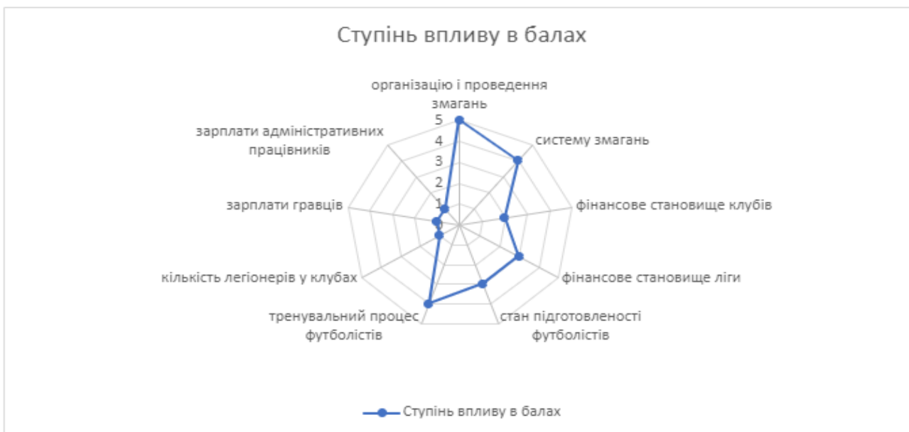
Рис 3.1. Напрямки впливу пандемії у вищій лізі з футболу

У першій лізі (рис. 3.2) найбільше пандемія вплинула на: