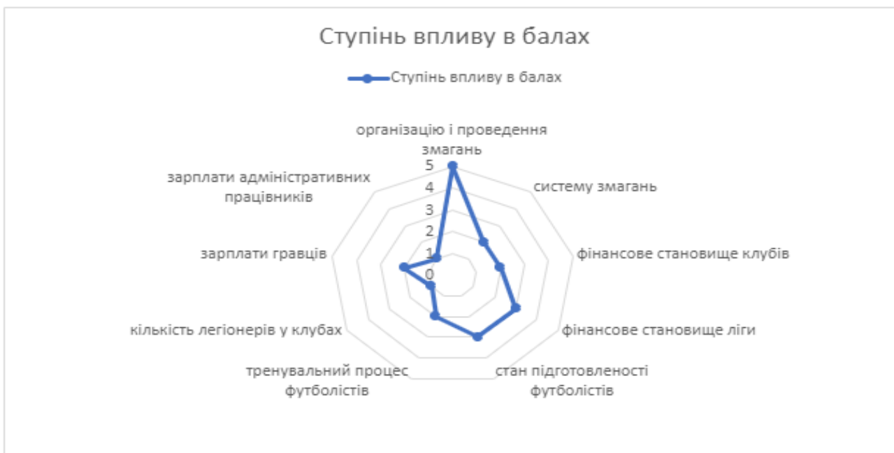
Рис 3.3. Напрямки впливу пандемії у другій лізі з футболу

За інформацією, представленою інтернет-виданням Главком від 30.05.2020 [6], Українська асоціація футболу отримала 4,3 млн євро допомоги від УЄФА на боротьбу корона вірусом. Експерти зазначили, що ці гроші витрачені на: