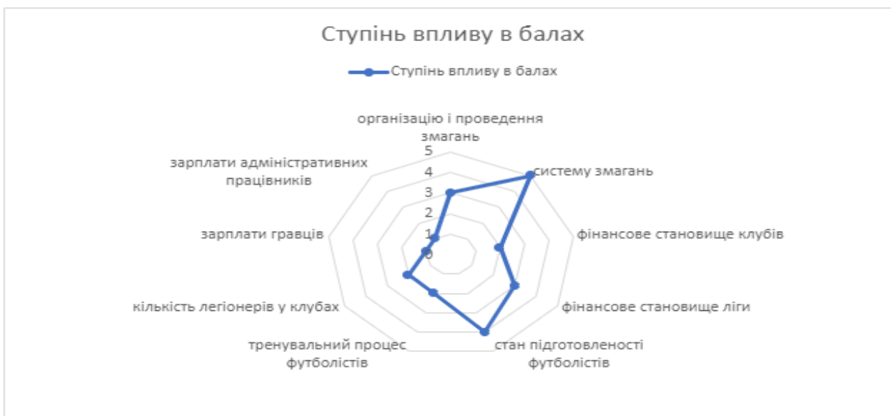
Рис 3.2. Напрямки впливу пандемії у першій лізі з футболу

У другій лізі (рис. 3.3) найбільше пандемія вплинула на: