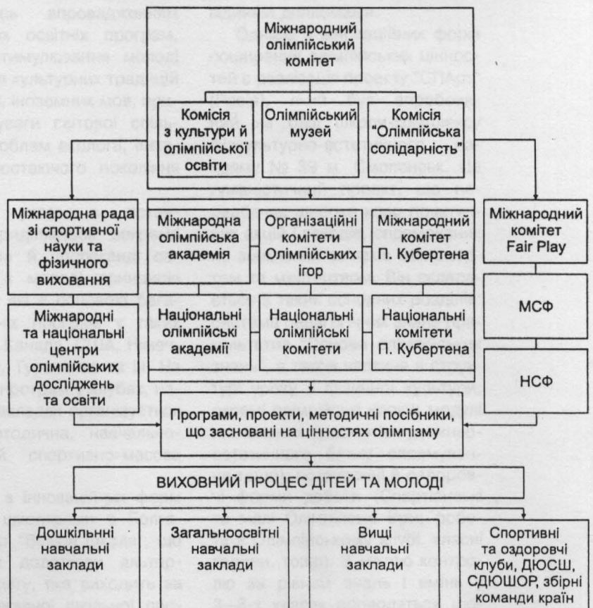
Рисунок 1 — Особливості поширення олімпійської освіти в світі

Олімпійська освіта стала одним із головних напрямів діяльності МОК і структур, що входять до системи міжнародного олімпійського руху. Поширення олімпійської освіти у світі здійснюється шляхом розробки й впровадження спеціальних програм та інноваційних виховних проєктів у навчально-виховний процес дітей і молоді (рис. 1).