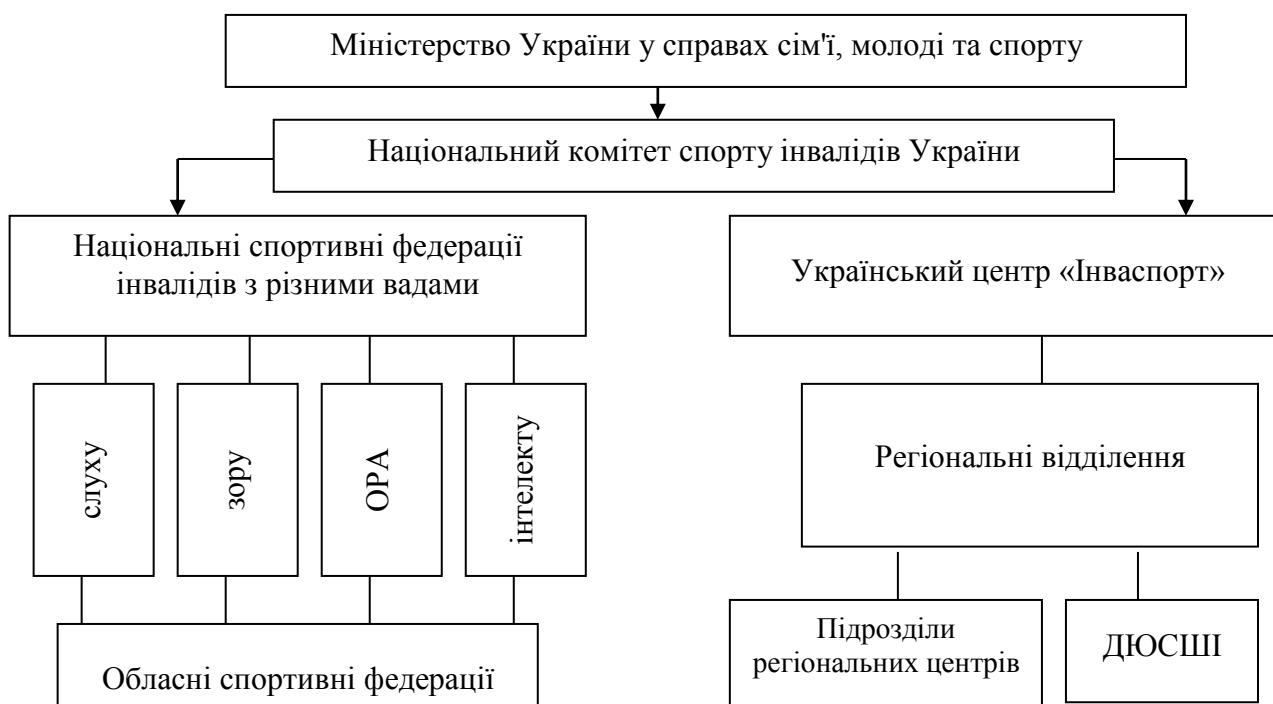
Рис. 1. Організаційна структура управління спорту інвалідів

Українські збірні команди спортсменів-інвалідів беруть активну участь у міжнародних змаганнях різного рівня та посідають визначні місця [1]. Так, у 2004 р. на XII літніх Паралімпійських іграх у неофіційному заліку наша команда посіла VI місце, у 2005 р. на XX літніх Дефлімпійських іграх – I, а XVI зимових Дефлімпійських іграх (2007 р.) – V місце.