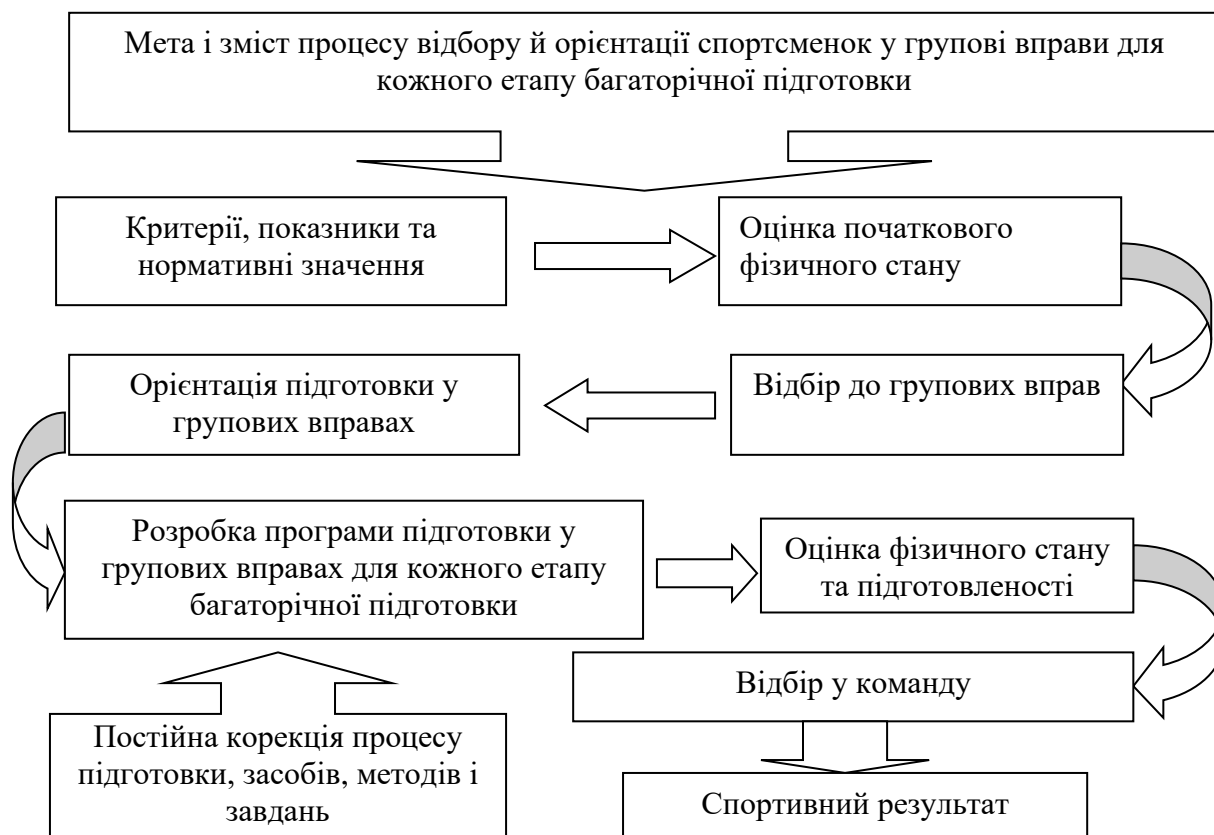
Рис. 2. Структурна схема технології відбору, орієнтації та підготовки спортсменок у групових вправах

Технологію відбору та орієнтації ми розглядали як упорядковану сукупність дій, операцій і процедур, що забезпечують досягнення прогнозованого результату, котру представлено у вигляді схеми (рис. 2).