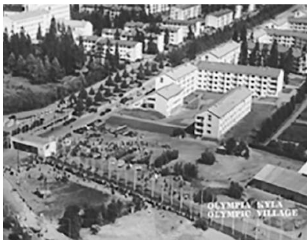
Отаміємі, олімпійське селище, 1952 р.

В олімпійському містечку Отаміємі, де мешкала делегація радянських спортсменів, завжди було багато відвідувачів. На запрошення делегації СРСР приходили спортсмени Швеції, Австралії, Данії, Фінляндії, Великої Британії, Південної Африки, щоб послухати концерти, подивитися кінофільм, обмінятися досвідом.