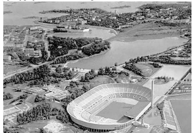
Олімпійський стадіон в Гельсінкі, 1952 р.

Міста Фінляндії, де проходили олімпійські змагання, були прикрашені плакатами і лозунгами, присвяченими боротьбі за мир. Так, у порту Турку шведською, фінською, англійською та