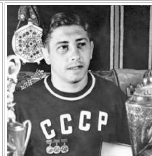
Яків Пункін – легендарний український борець, що після концтаборів Другої світової війни зійшов на найвищу сходинку олімпійського п'єдесталу в Гельсінкі