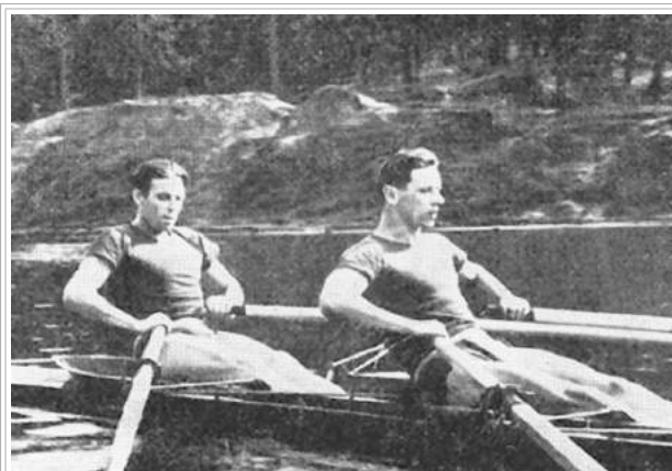
Ігор Ємчук і Георгій Жилін двічі ставали призерами Ігор з академічного веслування: срібними – на Іграх XV та бронзовими – Іграх XVI Олімпіад

Він володар 11 олімпійських медалей Гельсінкі й Мельбурна, серед яких сім золотих (1952, 1956), три срібні (1952, 1956) та одна бронзова (1956), абсолютний чемпіон світу (1954), чемпіон світу та бронзовий призер в окремих видах багатоборства (1954) заклав початок безпрецедентній шерензі олімпійських перемог школи українських гімнастів. Його життєвий та спортивний шлях – приклад мужності, героїзму та відданості спорту.