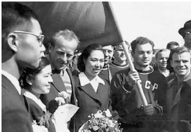
Ігри XV Олімпіади 1952 р. в Гельсінкі

Згадаємо 1952 рік. Збірна команда СРСР уперше взяла участь в Іграх XV Олімпіади в Гельсінкі. До її складу увійшли 25 спортсменів України, які принесли команді СРСР 10 золотих, 11 срібних і 1 бронзову нагороду в особистих і командних змаганнях.