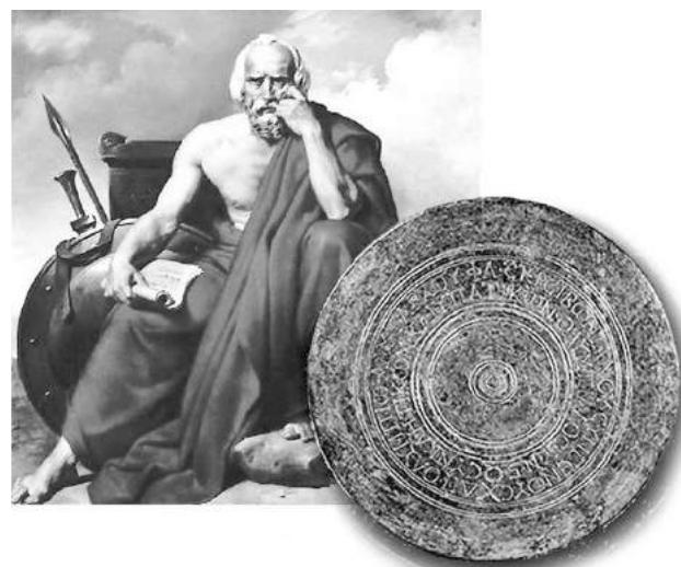
Зображення легендарного законодавця Спарти Лікурґа і диска Іфіта

Уперше олімпійське перемир'я уклали царі Спарти, Еліди та Писи – Лікурґ, Іфіт та Клейстен. Текст цього священного перемир'я, записаного на бронзовому диску, забороняв війни на час прибуття греків до Еліди, підготовки атлетів до Ігор, участі у змаганнях та повернення додому.