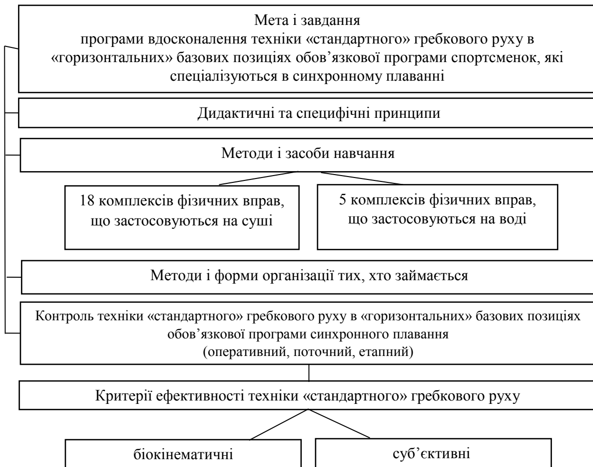
Рис. 1. Структурна схема реалізації експериментальної програми зі вдосконалення техніки «стандартного» гребкового руху спортсменок 11–12 років, які спеціалізуються в синхронному плаванні

В основу експериментальної програми лягли дидактичні та специфічні принципи спортивної підготовки (Л.П. Матвеев, 1999–2005, В.М. Платонов, 2004–2014, Ю.К. Гавердовський, 2007–2013). Блок-схема експериментальної програми представлена на рис. 1.