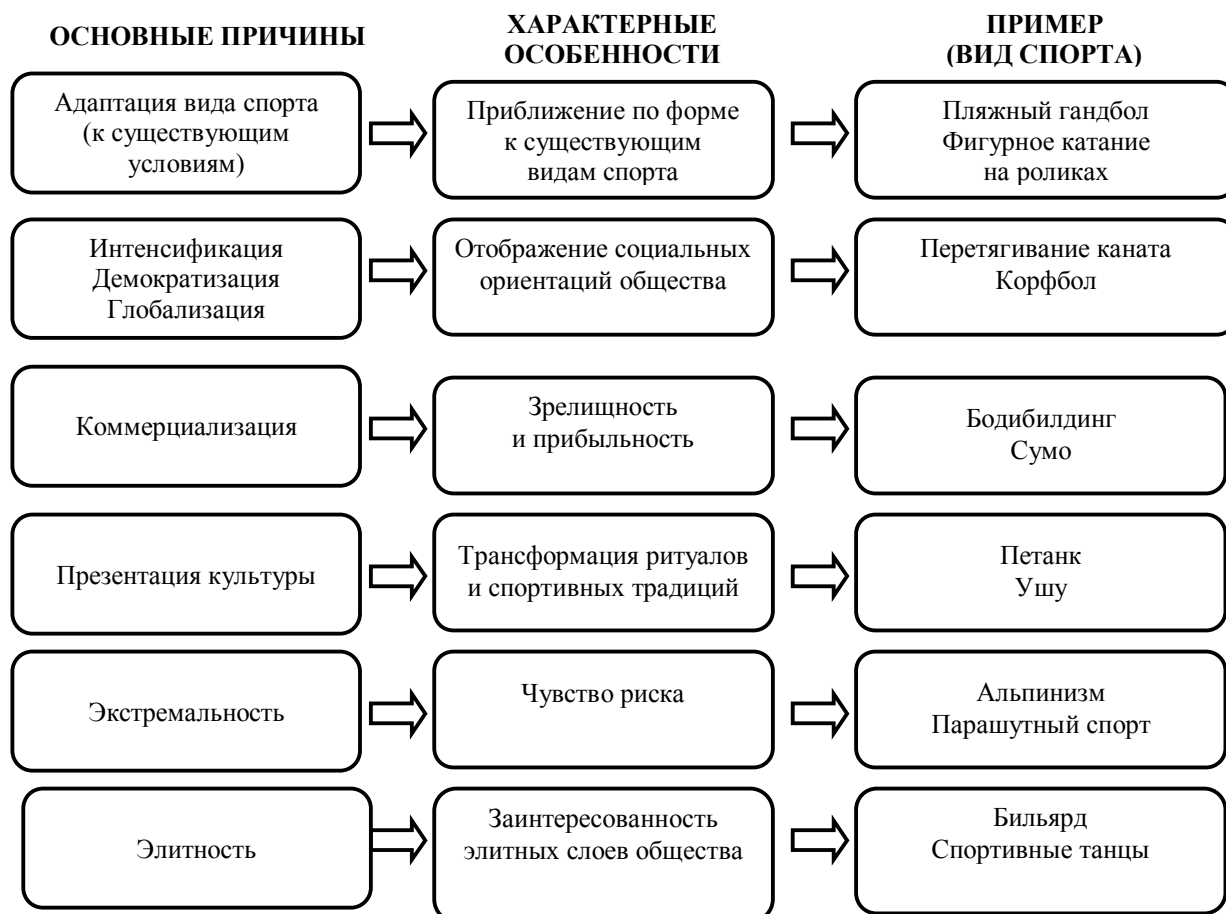
Рис. 3. Причины возникновения новых форм двигательной активности

В процессе эволюции различных форм двигательной активности происходит их многоэтапное трансформирование в вид спорта [4]. В современном мире спорт является неотъемлемой частью жизни общества и представляет собой сложную многоуровневую структуру (рис. 4).