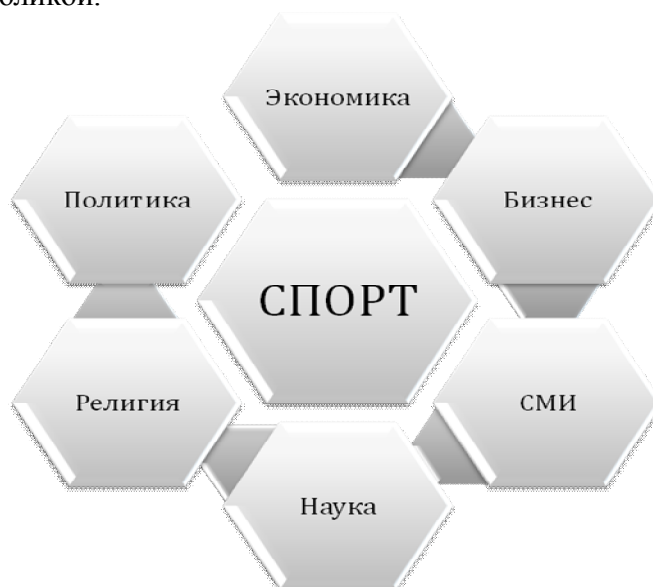
Рис. 1. Спорт и другие социальные институты

Популярность и имидж спорта в мире побуждает другие социальные институты тесно сотрудничать с ним (рис. 1). Взаимоотношения спорта с политикой, экономикой, бизнесом, религией, СМИ, наукой имеют как положительные, так и отрицательные моменты. С одной стороны, развитие спорта невозможно без государственной и частной поддержки, внимания теле- и радиокompаний, интернет-ресурсов, научного обеспечения. С другой стороны, спорт является инструментом, с помощью которого довольно часто политики, предприниматели и бизнесмены решают свои вопросы, используя спорт средством достижения цели. Например, в церемонии открытия Всемирных Игр 2009 г., которые проходили в г. Гаосюн (о. Тайвань), не приняли участие представители Китайской Народной Республики (материковая часть Китая), с целью демонстрации наличия политических проблем между Республикой Китай и Китайской Народной Республикой.