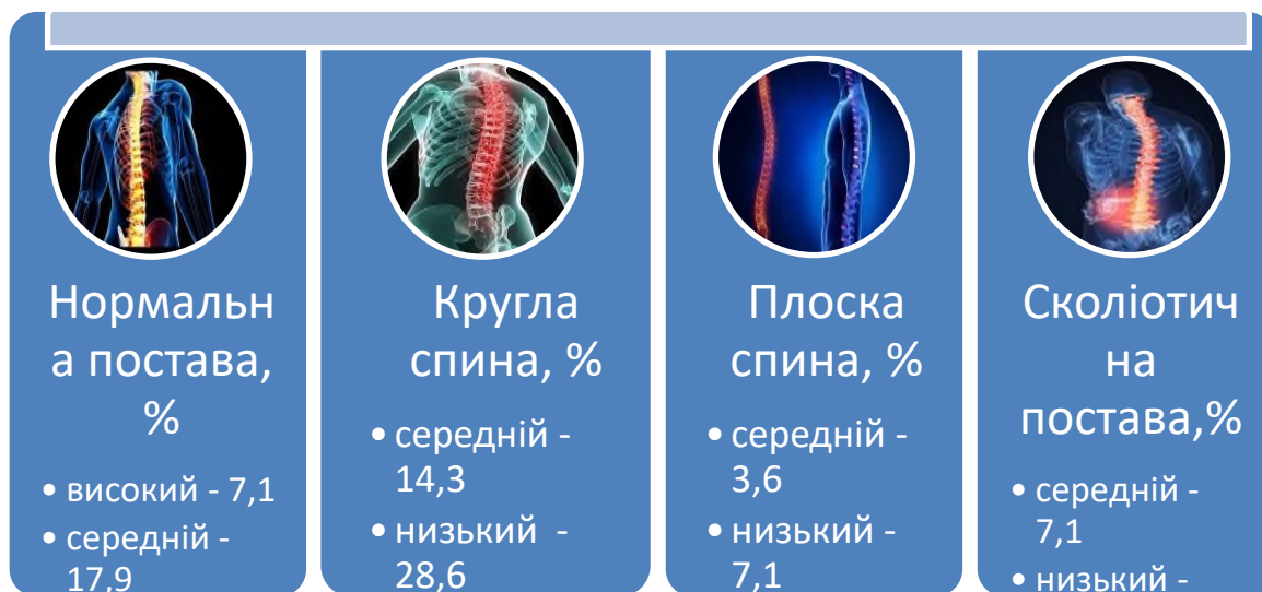
Рис. 3. Розподіл чоловіків 41–45 років за рівнями біогеометричного профілю постави (n = 28)

Перевірка отриманих вибірових даних за показниками асиметрії й ексцесу встановити, що показники стану біогеометричного профілю постави чоловіків 36–45 років мають нормальний розподіл (табл. 1).