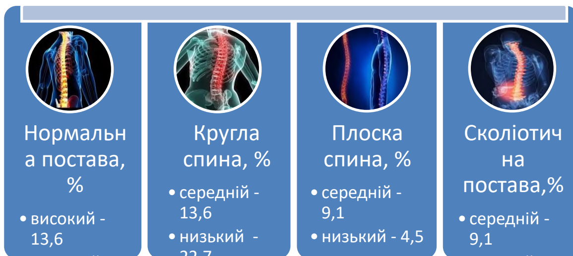
Рис. 2. Розподіл чоловіків 36–40 років за рівнями біогеометричного профілю постави ( n = 22 )

Виконаний розподіл чоловіків 36–40 років за рівнями біогеометричного профілю постави засвідчив, що серед чоловіків із нормальною поставою чоловіки з середнім і високим рівнями біогеометричного профілю розподілилися порівну та їх частки становили 13,6 % ( n = 3 ). При цьому серед чоловіків із круглою спиною виявилося на 9,1 % більша частка із низьким рівнем, ніж із середнім, як і в обстежених зі сколіотичною поставою, у яких різниця між частками – 4,5 %, а з-поміж чоловіків із плоскою спиною – навпаки, частка із середнім рівнем біогеометричного профілю постави переважала частку з низьким рівнем на 4,5 % (рис. 2). У фронтальній площині рівень стану біогеометричного профілю їх постави становить (8,77;3,25 бала), а в сагітальній – (10,14;2,93 бала). З’ясувалося, що серед чоловіків 41–45 років із нормальною поставою частка з високим рівнем біогеометричного профілю постави на 10,8 % менша, ніж із середнім (рис. 3).