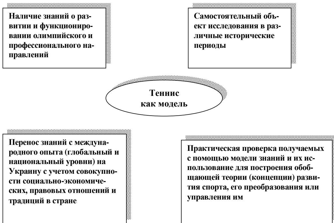
Рис. 2. Аспекты рассмотрения тенниса как модели развития спорта в стране

спорте профессии, система финансирования, взаимоотношения с различными субъектами рынка находятся на стадии формирования, то в теннисе указанные процессы давно завершились, а отличия заключаются в различных исторических периодах. Ведь если сегодня МОК не только позитивно относится к профессионализации и коммерциализации спорта, но и принимает активное участие в данных процессах, то в 1928 г. это было камнем преткновения и теннис исключили из олимпийской программы.