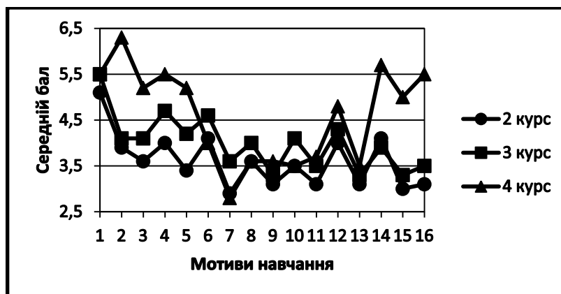
Рис. 1. Інтенсивність (сер. бали) мотивів навчальної діяльності студентів