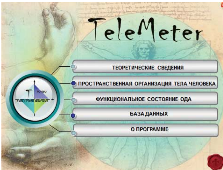
Рис. 2. Распечатка с экрана компьютера. Меню измерительно-информационной системы «TeleMeter» [8]

качественных и количественных показателей биогеометрического профиля осанки [6, 12]. Несмотря на такой многовекторный подход к человеческому телу, его описанию и пониманию, ученые пытались понять, измерить и классифицировать все многообразие внешних форм тела [6, 12].