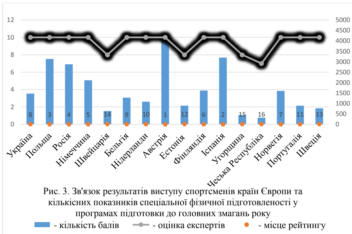
Рис. 3. Зв'язок результатів виступу спортсменів країн Європи та кількісних показників спеціальної фізичної підготовленості у програмах підготовки до головних змагань року

Контент-аналіз підсумкових протоколів змагань з дисциплін «14+1», «8-ка», «10-ка» та «9-ка» на чемпіонаті Європи 2016 з пулу серед чоловіків та жінок, дозволив визначити прямий взаємозв'язок між результатами виступів спортсменів та особливістю розподілу тренувального навантаження у програмах підготовки висококваліфікованих більярдистів країн-учасниць. Для визначення рейтингу країн за результатами виступу спортсменів на чемпіонаті Європи (1-5 місця), використовувалася система підрахунку балів згідно положення про рейтинг з неолімпійських видів спорту Спортивного комітету України. На рис. 3 відзначається високі показники виступу на змаганнях більярдистів саме тих країн, експерти яких виставили максимальну оцінку щодо обов'язкового планування у програмі навантаження зі спеціальної фізичної підготовки висококваліфікованих більярдистів у кількісних параметрах – 10% або більше.