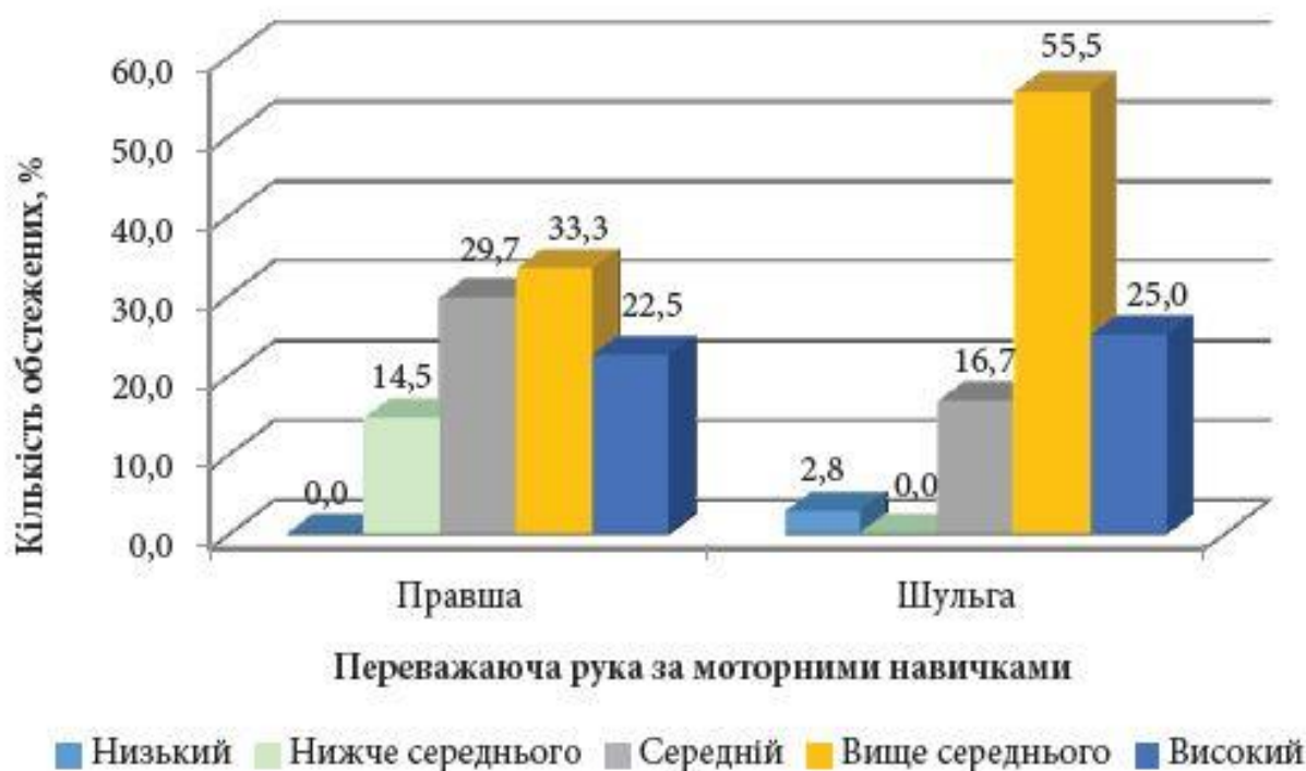
Рис. 3. Розподіл рівнів фізичного стану за О.А. Пироговою залежно від переважаючої руки студентів

Здійснено порівняння рівнів фізичного стану студентів першокурсників залежно від переважаючої руки за моторними навичками. Вид переважаючої руки встановлено у 147 студентів, з них — правші 111 (75,51 %), шульги — 36 (24,49 %) осіб. Розподіл рівнів фізичного стану залежно від переважаючої руки студентів наведено на рис. 3.