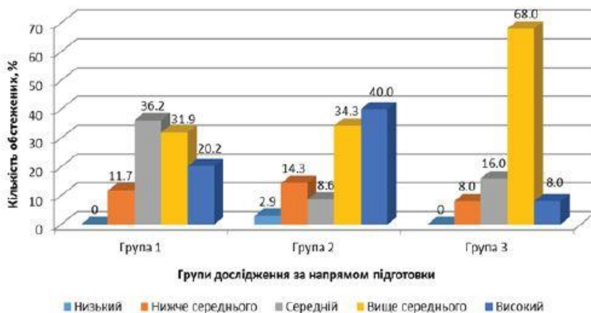
Рис. 2. Розподіл рівнів фізичного стану за О.А. Пироговою залежно від напрямку підготовки студентів