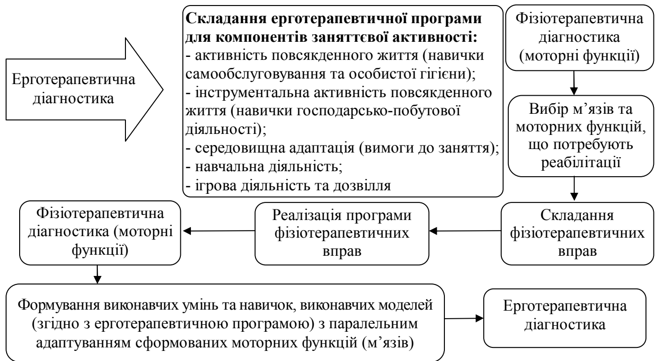
Рис. 1. Процес реабілітації дітей з дитячим церебральним паралічем

пацієнта до процесу ерготерапії з самого початку та підвищувало рівень включення у терапевтичний процес.