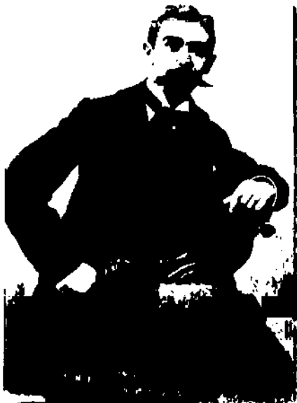
Барон П'єр де КУБЕРТЕН

◆ На початку заняття ми з вами ознайомилися з історією виникнення поняття Fair Play. Сьогоднішнє трактування поняття сягає періоду становлення сучасних правил спортивних змагань, встановлених у XIX ст. в Англії, де спорт вважався захопленням переважно середніх і вищих класів. Для них це заняття було швидше розвагою, ніж засобом, що приносить доходи. Тоді й склався певний кодекс джентльмена-спортсмена, що дотримується строгих правил змагань.