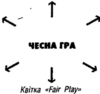
Квітка «Fair Play»

◆ Якщо групи називають однакові складові, їх все одно прикріплюють до малюнка. Це дасть змогу визначити спільність поглядів учнів.