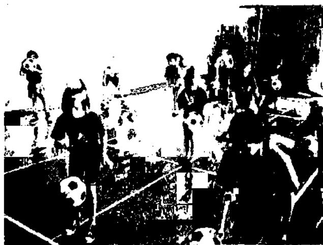
Ознайомлення зі школою м'яча