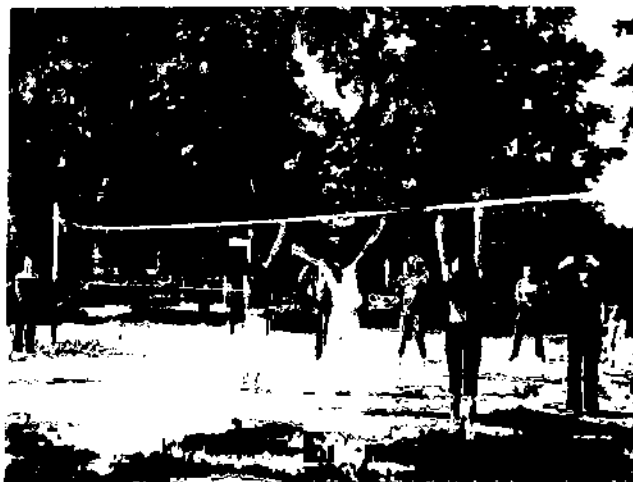
На волейбольному майданчику

До загальношкільного плану роботи включено проведення фізкультурно-оздоровчих за-