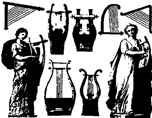
Музичні інструменти у Стародавній Греції

Переклад з грецької слова «закон» має багато значень. Одне з них – «музичний твір строгої форми». Цікаво, яке відношення воно має до закону? Саме тому, що для греків музика була найдосконалішим втіленням порядку. Коли всі звуки узгоджені, людина чує прекрасну мелодію, а коли хоча б один звук випадає із узгодження, гармонія втрачається. Там, де у світі все впорядковано, сама собою виникає музика: дивлячись на розмірений рух небесних світил, греки вірили, що вони породжують дивовижно гармонійні звуки. «Музику сфер», а ми її не чуємо через те, що змалечку звикли до неї. Там, де виникає музика, все знаходить свій порядок. Коли міфічний Орфей грав на лірі, то дикуни переставали бути дикунами, подавали одне одному руку, домовлялися про спільні закони і починали жити родинами, містами, державами.