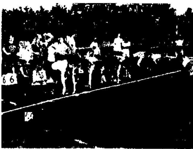
На спортивних доріжках