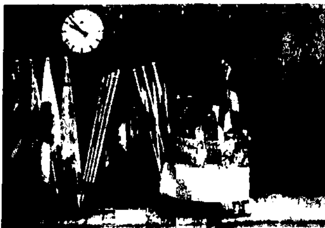
Делегація України – представники школи № 142 м. Дніпра

1997 р. Міжнародний комітет П'єра де Кубертена (CIPC) ініціював і провів свій Конгрес «Кубертен та олімпізм – питання майбутнього». У рамках роботи Конгресу було організовано перший Молодіжний форум шкіл Кубертена.