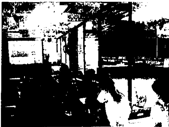
У дискусійному клубі

нального олімпійського комітету України Сергія Бубки з проханням знайти можливість відрядити делегацію України на зазначений форум і отримала позитивне рішення. Представники дніпровського навчального закладу достойно представили Україну на цьому престижному міжнародному форумі.