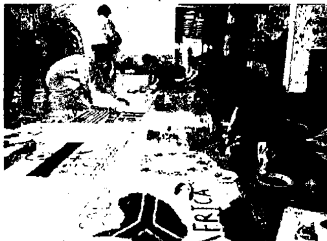
Колективна робота зі створення банера

Сьогодні в світі діють школи Кубертена у 40 країнах світу. З часу проведення Конгресу в Гаврі (1997 р.) та успіху першого Молодіжного форуму, CIPC активізував свою діяльність щодо молодіжної політики і займається пошуком шкіл у всьому світі, які свою діяльність асоціюють з ідеалами, що проповідував Кубертен, і заслуговують носити високе ім'я педагога, громадського діяча та ініціатора відродження сучасних Олімпійських ігор.