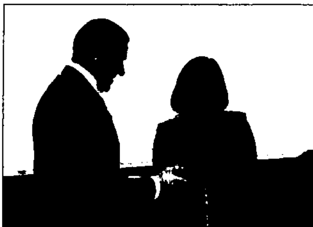
Сергій Бубка отримує від Марії Булатової Диплом почесного члена Олімпійської академії України

22 січня 2010 року в м. Києві відбулась ХІ сесія Олімпійської академії України. У роботі Сесії взяли участь Президент Національного олімпійського комітету України Сергій Бубка , 26 керівників регіональних відділень Олімпійської академії України, керівники регіональних центрів олімпійської освіти та досліджень, представники вищих навчальних закладів та громадськості України.