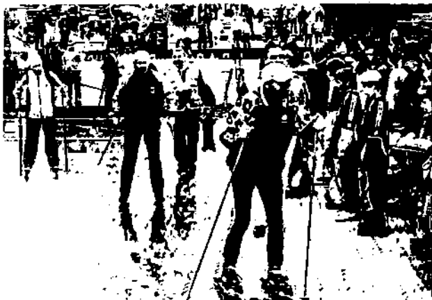
Показові виступи представників Федерації лижного спорту України