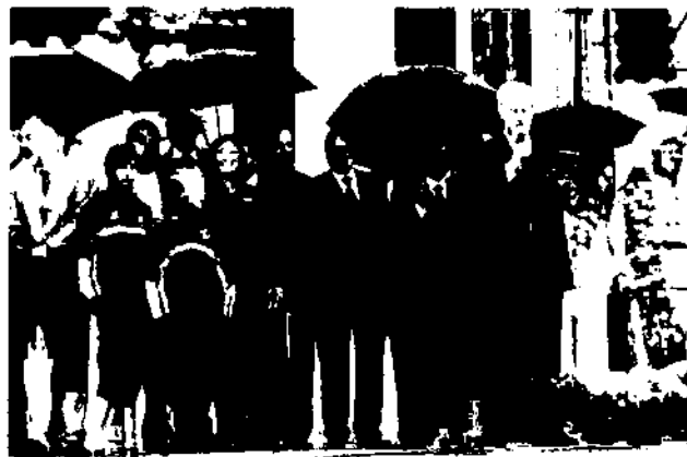
Представники уряду, НОК і Олімпійської академії України вітають учасників свята