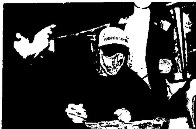
Навчально-пізнавальна гра «Олімпійські перегони»