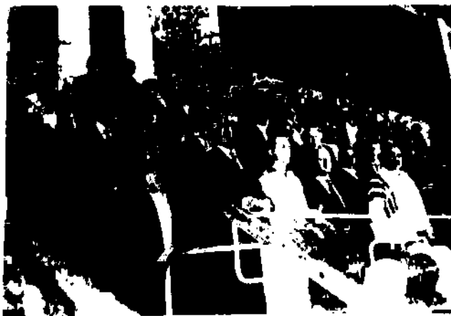
Звучить олімпійський гімн