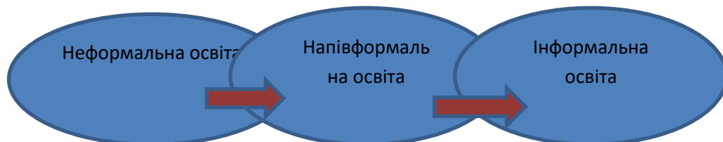
Рис.2. Позиція напівформальної освіти (точка зору А. Кукульська-Хульма та Дж. Петіт)

Рис.1. Позиція напівформальної освіти (точка зору Дж. Гольдштейна) у рамках різних товариств, спільнот. Наприклад, майстер-класи для та професійного розвитку, клуби однодумців, навчальна система бадді (навчання у форматі «товариш-товариш»), он-лайн середовища [15, с.33-36]. Таким чином, позиція напівформальної освіти чітко не визначається. Адже особистісний розвиток переважно асоціюється з інформальною освітою, а он-лайн середовища можуть належати як до формальної освіти (у випадку дистанційного навчання з метою здобуття диплому), до неформальної освіти (у випадку он-лайн курсів) чи до інформальної освіти (спілкування у соціальних мережах). Графічно можна зобразити напівформальну освіту на межі неформальної та інформальної (рис.2).