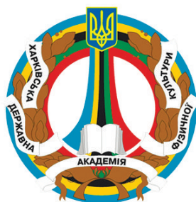
Харківська державна академія фізичної культури