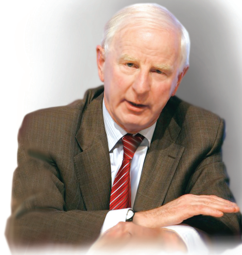
Президент ЄОК ПАТРИК ХІКІ

Поділіться олімпійськими ідеалами і цінностями з нами!