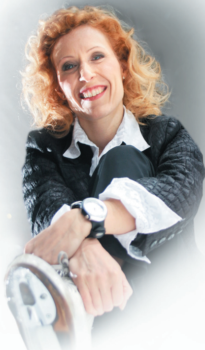
СУСАННА РАХКАМО Голова комісії ЄОК з олімпійської культури і спадщини