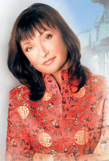
МАРІЯ БУЛАТОВА, професор, президент Олімпійської академії України