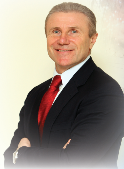
СЕРГІЙ БУБКА Член Виконкому МОК, віце-президент IAAF, президент НОК України

Унікальний світ олімпізму кличе вас! Нехай олімпійський вогонь, запалений в легендарній Олімпії, крокуючий до олімпійських столиць, запалить у ваших серцях доброту, взаємоповагу, мир, дружбу і красу!