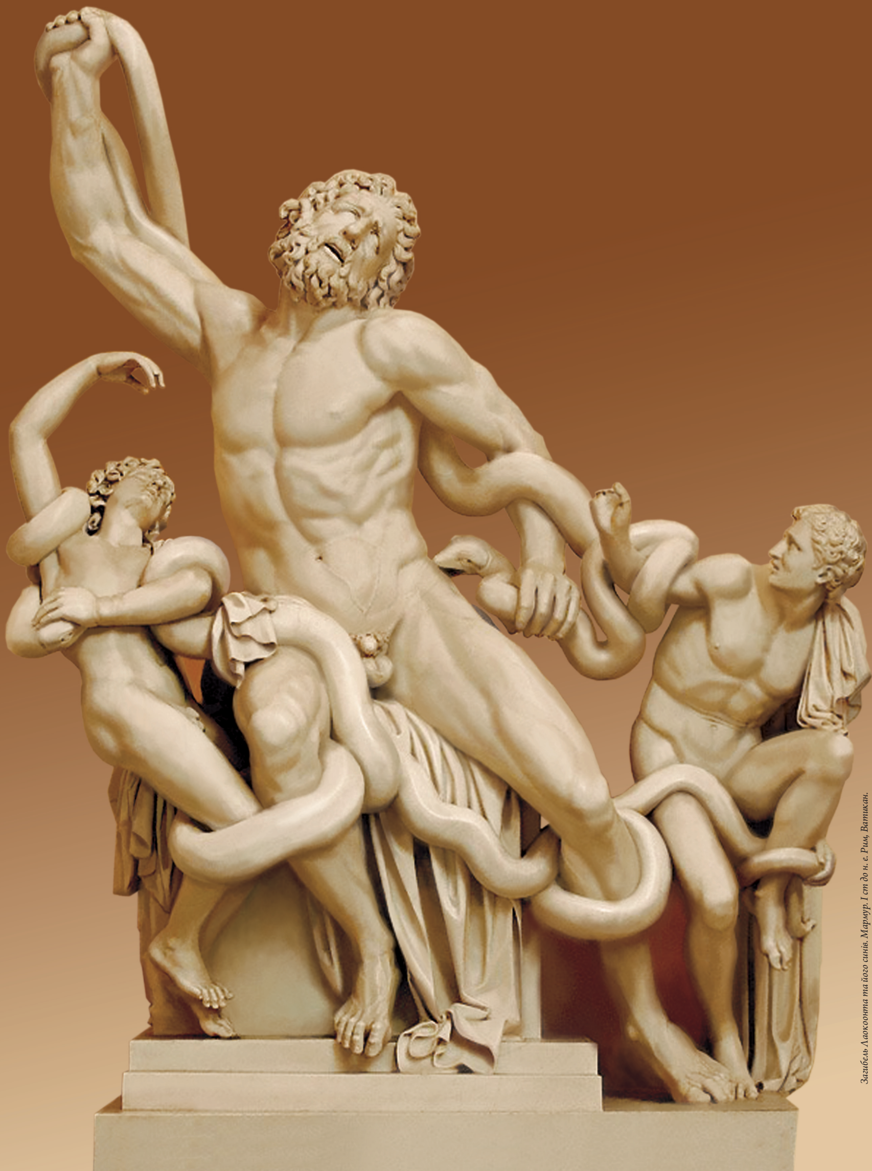
Загибель Лаохонтта та його синів. Мармур. I ст до н. е. Рим, Ватикан.