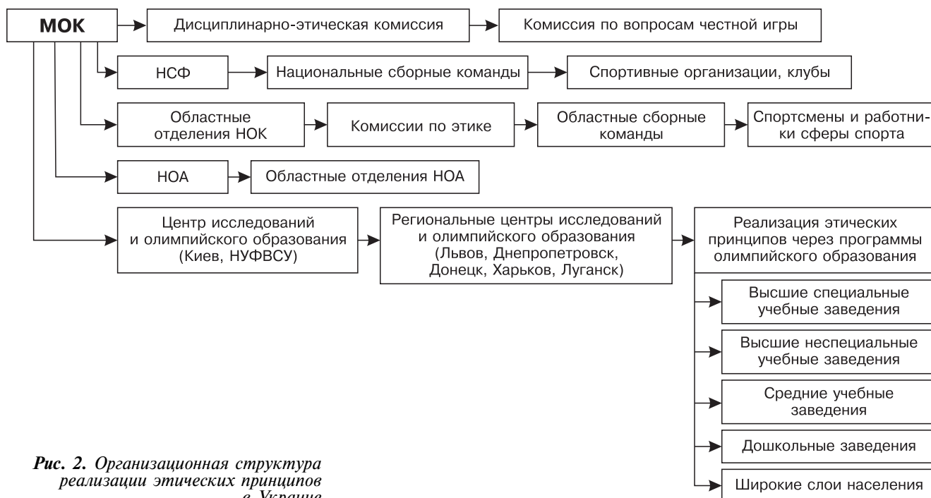
Рис. 2. Организационная структура реализации этических принципов в Украине

Сегодня олимпийская победа и ее творцы воспринимаются как национальное достояние. Среди причин, отрицательно влияющих на соблюдение нравственности в спорте, можно выделить политизацию, коммерциализацию, профессионализацию. Они провоцируют допинг-скандалы, случаи коррупции в олимпийском движении, агрессию, нечестную игру и т.п. Остановимся на