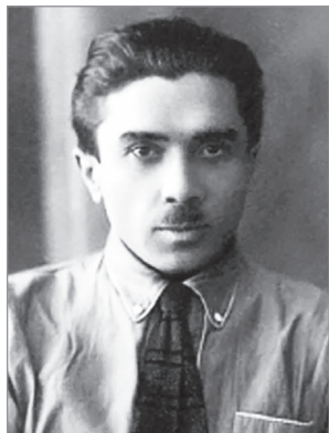
Микола Хвильовий (1893–1933)

Концепт «України на межі» у Миколи Хвильового. Одним із найбільш яскравих прикладів конструювання геополітичної фігури «Україна-між» можна вважати погляди ідеолога культурно-національного відродження 1920-х рр., класика української літератури, націонал-комуніста Миколи Хвильового (Фітільова) (1893–1933). Культурне піднесення 20-х рр. ХХ ст. ввійшло в українську історію під назвою «розстріляного відродження» (цей термін уперше вжив у 1959 р. літературознавець Юрій Лавріненко ). Політика «українізації», яку більшовики особливо активно почали