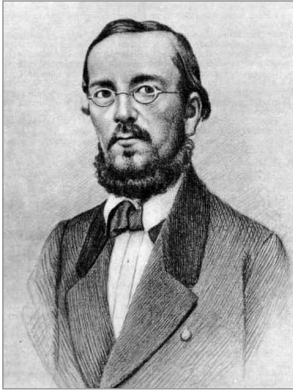
Микола Костомаров (1817–1885)

Таким чином, відкривається «душа народу», «дух народу», національний характер, як ті внутрішні первні, що визначають рух зовнішньої історії народу. Костомаров у повній згоді з цими постулатами романтизму також виділяє в історії два шари – зовнішній і внутрішній. З його точки зору, коли історик вивчає інститути держави, дипломатію чи війни, то він ніби «ковзає по поверхні життя» тому, що це лише «коло зовнішніх явищ» історії. Проникнення ж у суть, «глибини» історії розпочинається із вивчення життя простого народу, в результаті якого нам і відкривається «внутрішній склад