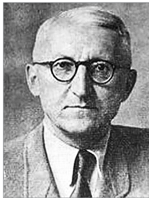
Микола Шлемкевич (1894–1966)

Непевність екзистенції вкорінена в умові історії – мінливому часі. Початкова свобода екзистенції, що існує в часі, породжує такі стратегії проживання в ньому, що можуть бути названі розмаїттям можливостей . Екзистенція існує в умовах, коли завжди є можли-