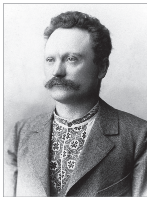
Іван Франко (1856–1916)

Первісній добі в цілому найбільш повною мірою притаманна дія дарвіністського закону боротьби за існування. Самі позитивісти охоче послуговувалися постулатами дарвінізму, застосовуючи їх до соціального життя. Першим соціал-дарвіністом із повним правом можна назвати все того ж Спенсера , у соціологічній теорії якого дарвіністські аргументи займають центральне місце. Молодий