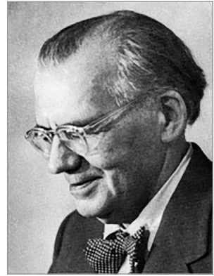
Дмитро Чижевський (1894–1977)

При цьому виразно проглядається, як уже зазначалося, що підґрунтям рефлексій над історичним виміром людського буття у Чижевського є гегелівська теорія історичного процесу (принаймні це твердження правильне для 1920–1930 рр.). До ідеї світового духу, який у певний проміжок часу робить, так би мовити, ставку на той чи інший народ/націю, знаходячи у ньому найвище для певного етапу вираження і стаючи «духом народу», Чижевський ставиться досить прихильно. Цей «історичний «дух»... – пише він, – виконує свою історичну місію, ніби доручаючи її виконання в окремі історичні епохи окремим народам або їх групам».