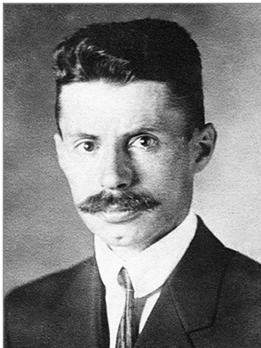
В'ячеслав Липинський (1882–1931)

Власне, етнографічна маса, об'єднана спільними матеріальними умовами свого життя, має неусвідомлені «стихийні хотіння до буття собою, до заховання, до поширення себе». Провідна ж верства – це ті, хто усвідомив приспані потяги землеробського етносу (вони є своєрідним національним буттям-у-собі) й оформив їх у політичні цілі. Отже, провідна верства є носієм національної ідеології, що раціоналізує стихийні бажання й хотіння пасивної етнографічної маси, які, у свою чергу, виникають на основі єдності людини й землі. Образно висловлюючись, національна аристократія « відіграє... ролю дріжджів, на яких пасивне етнографічне тісто того колективу росте і перетворюється в активну націю ». Таким чином, нація – це зорганізована на певній території у державу провідною верствою пасивна етнографічна маса. Крім того, провідна верства