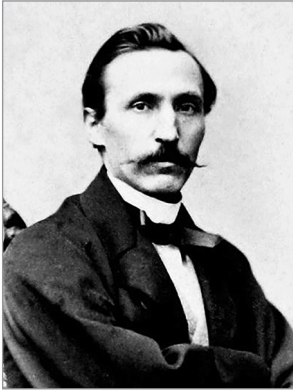
Пантелеймон Куліш (1819–1897)

воли біля клуні. Разом це і є ота рідна місцевість, батьківщина , яка є джерелом почуття рослинно-космічної сили для українського селянина.