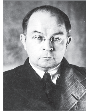
Віктор Петров (1894–1969)

самих істориків. Для Петрова історичний процес – це перебіг послідовності певних культурно-історичних відтинків, що зумовлені дискретністю часу. Кожен такий відтинок (епоха) має свої кризові стани. Головною ознакою кризи сучасної доби він називає почуття « несталості » особистості, що проявляється у суцільній релятивізації. Релятивізм – породження руйнівної сили техніки – призводить до стану перманентної втоми від плюралізму дріб'язкових істин, відсутності чітких моральних критеріїв.