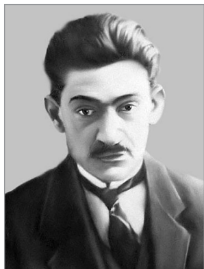
Дмитро Донцов (1883–1973)

«Активна меншість є суспільнотворчою силою, чи то будуть «варяги», чи конкістадори, чи певна кляса, що репрезентує націю, чи нація, що репрезентує їх «союз», чи горстка підбурювачів – скрізь меншість... Творче насильство як «що», ініціативна меншість як «хто» – ось підстава майже всякого суспільного процесу, спосіб, яким перемагає нова ідея», – зазначає Донцов у одній зі своїх основоположних праць – «Націоналізмі» (1926).