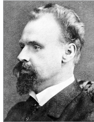
Богдан Кістяківський (1868–1920)

Звідси – й різні способи « роботи » із цими двома сферами, тепер уже у неокантіанстві. До сфери природи розум може застосувати категорію закону. Закон – це те, що відбувається з необхідністю, він є вираженням необхідності. Сфера ж власне не природного (штучного, результату людських діянь) у людині вимагає застосування зовсім іншого методологічного інструментарію, який би дозволив « схопити » цей рівень позаприродного. У лідерів баденської школи неокантіанства – В. Віндельбанда та Г. Рикерта – ці методологічні підходи називаються, відповідно, ідіографічним та індивідуалізуючим , і результатом приписування їх розумом до явищ історичного життя є бачення факту, події, ситуації у всій її неповторності, виокремленості від інших, може й подібних за якимись іншими ознаками, ситуацій. І навпаки, протилежні методи – знову ж таки, відповідно, номотетичний та генералізуючий – спрямовані на схоплення того спільного, що є в однорідних явищах природи, тобто у встановленні закону цих явищ.