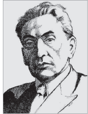
Юліан Вассиян (1894–1953)

Таким чином, продовжуючи розвивати ідеї філософії романтизму, Вассияну вдалося побудувати органічну модель взаємозалежності двох рівновеликих цілісностей, якими є індивід та нація. Вони не тлумачаться як відносини одиничного та цілого, де одиничне (індивід) є складовою цілого (нації), а індивід виступає швидше такою суспільною одиницею, що тільки внаслідок власного розвитку може об'єктивувати ідею нації. Тож нація – це не механічна сума самозамкнених одиниць, а органічна спорідненість і внутрішня солідарність індивідів, що виникають лише в результаті їх власного духовного самоздійснення.