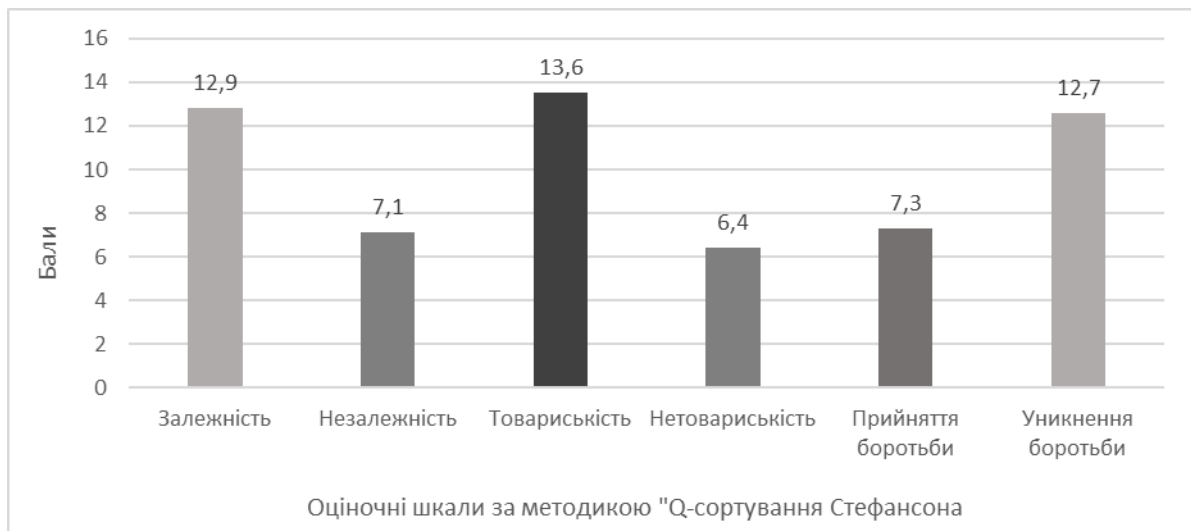
Рис. 1. Середні значення показників за методикою Q-сортування Стефансона серед футболістів групи початкової підготовки (9-10 років)

Аналіз середніх значень за шкалою «залежність-незалежність» вказує на те, що на етапі початкової підготовки юним гравцям властива більш залежна поведінка. Це пояснюється не тільки віковими психологічними особливостями дітей 9-10 років (незрілість, конформізм), а й вказує на важливість та визначну роль адекватної поведінки тренера та його відповідного стилю управління і навчання.